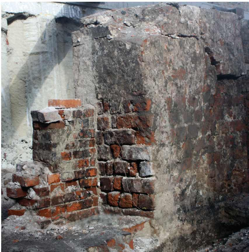
Fot. 1. Widoczny fragment muru 1. fazy budowlanej

Dzisiejsza ulica Oławska znajduje się na terenie najstarszej części miasta. Początków jej urbanizacji w części przyległej do Rynku można doszukiwać się jednocześnie z lokacją miasta w połowie XIII wieku [1, s. 22], natomiast zabudowa omawianej działki prawdopodobnie nastąpiła nieco później, wraz z rozwojem układu urbanistycznego [1, s. 19]. Pierwotnie były to zapewne budowle drewniane, chociaż przez analogię do odkrytej w ramach badań C. Lasoty i J. Rozpędowskiego murowanej