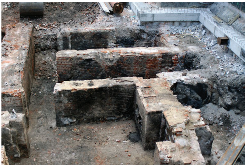
Fot. 2. Widok na południową część działki. W prawym dolnym narożniku zdjęcia widoczny mur zaliczony do fazy 2., pozostałe widoczne mury zaliczono do fazy 3. i 4.

Usytuowanie działki w zwartej zabudowie śródmiejskiej, bezpośrednio przy ruchliwych traktach komunikacyjnych, mogłoby przy zakładanej głębokości wykopów generować niebezpieczeństwo obsunięć gleby i uszko-