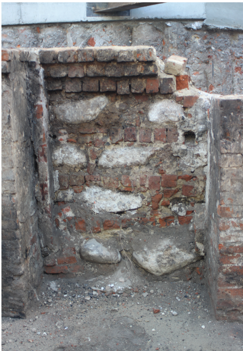
Fot. 3. Widok na fragment muru fazy 2.