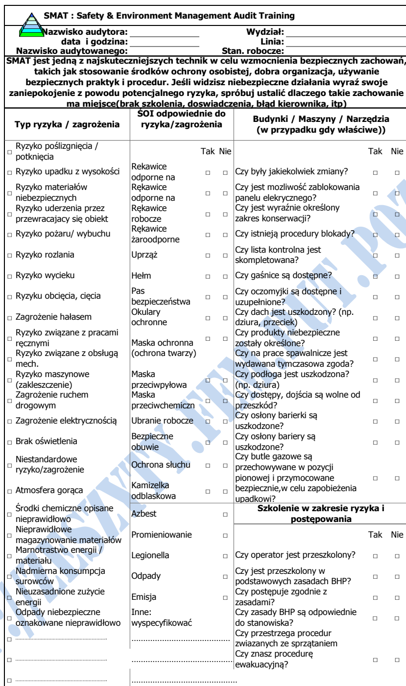
Rys. 5. Przykładowy arkusz SMAT [11]