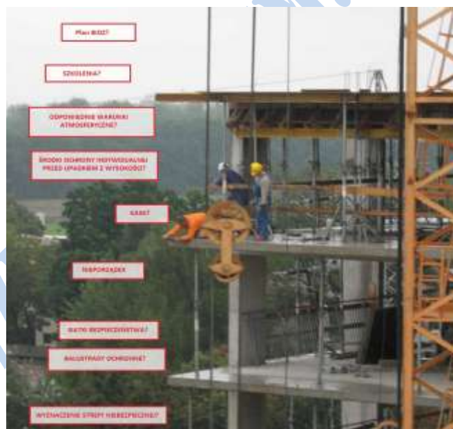
Rys. 4. Szybka wizualizacja – zagrożenia podczas pracy na budowie (oprac. własne na podst. [3])