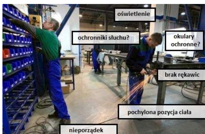
Rys. 3. Szybka wizualizacja – zagrożenia podczas pracy w hali produkcyjnej (oprac. własne na podst. [5])

Kluczową rolę odgrywają tak zwane szybkie obserwacje pozwalające na skupienie uwagi na niebezpiecznym zachowaniu, np. na tym, gdzie patrzy pracownik lub czy ma bezpieczne obuwie. Taka forma ma zwrócić uwagę na problem, a jej zaletą jest szybkość i precyzyjne wskazanie problemu (rys. 3 i 4).