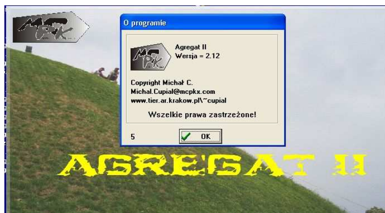
Rys. 3. Przykładowe okno programu