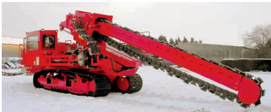
Fot. 1. Miecz trenchera z kompletem frezów skrawająco-mieszających