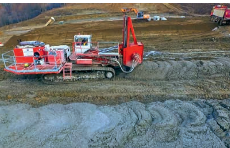
Fot. 3. Wzmocnienie podłoża gruntowego w technologii TRMX

Doświadczona kadra projektowa i nadzór techniczny z ramienia konsorcjum geotechnicznego oraz bogate zaplecze naukowo-techniczne pozwoliły na wypracowanie optymalnej koncepcji i zrealizowanie trudnego zagadnienia geotechnicznego.