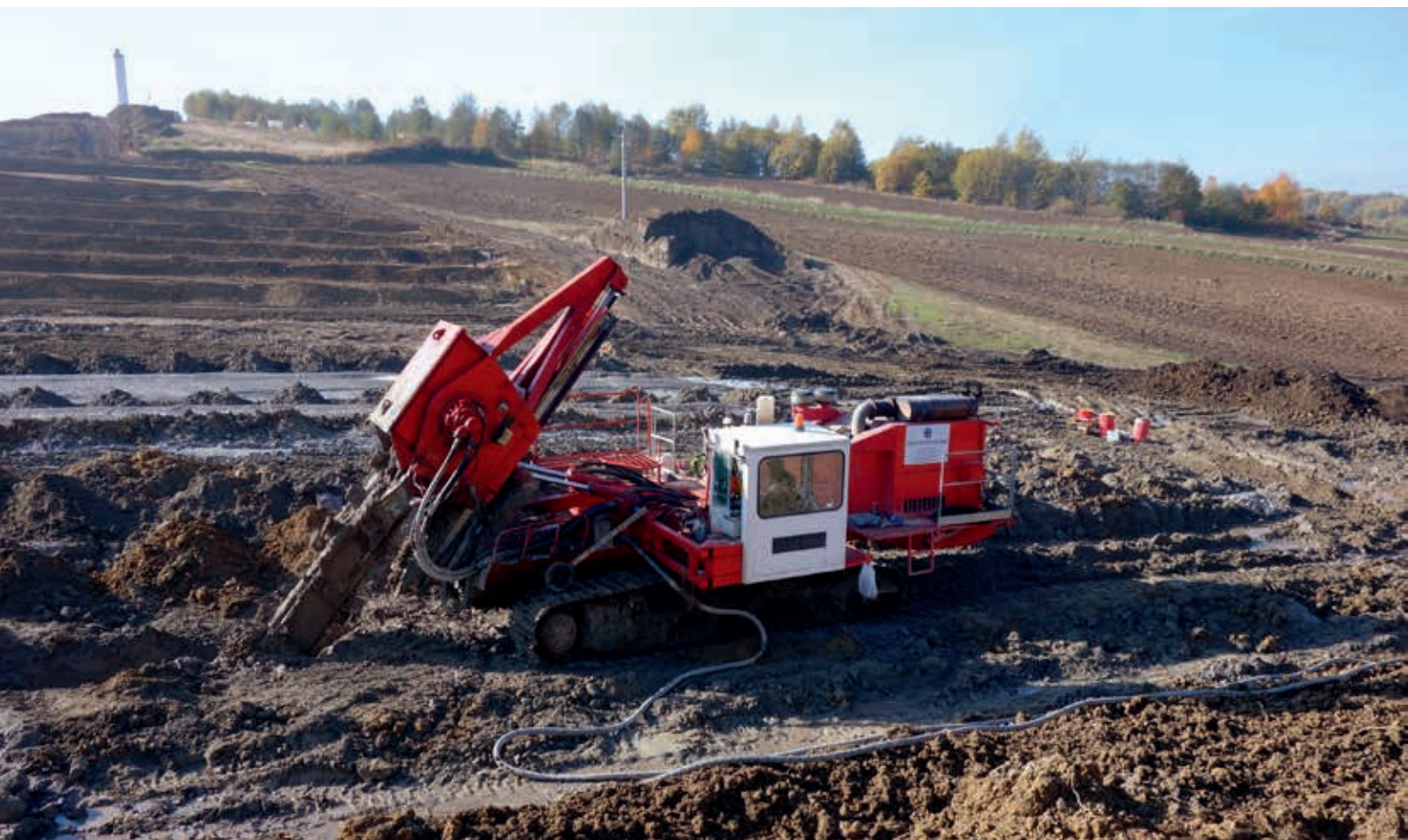
Fot. 2. Ukształtowanie terenu oraz schodkowanie platformy