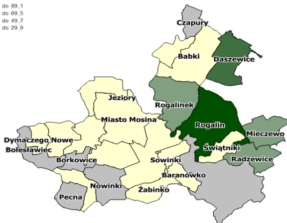
Rys. 3. Przewidywana wartość gruntów pod zabudowę w roku 2006 w gminie Mosina