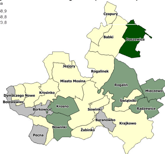
Rys. 2. Przewidywana wartość gruntów pod zabudowę w roku 2005 w gminie Mosina

Fig. 2. Forecasted value of land allocated to development in 2005 in Mosina