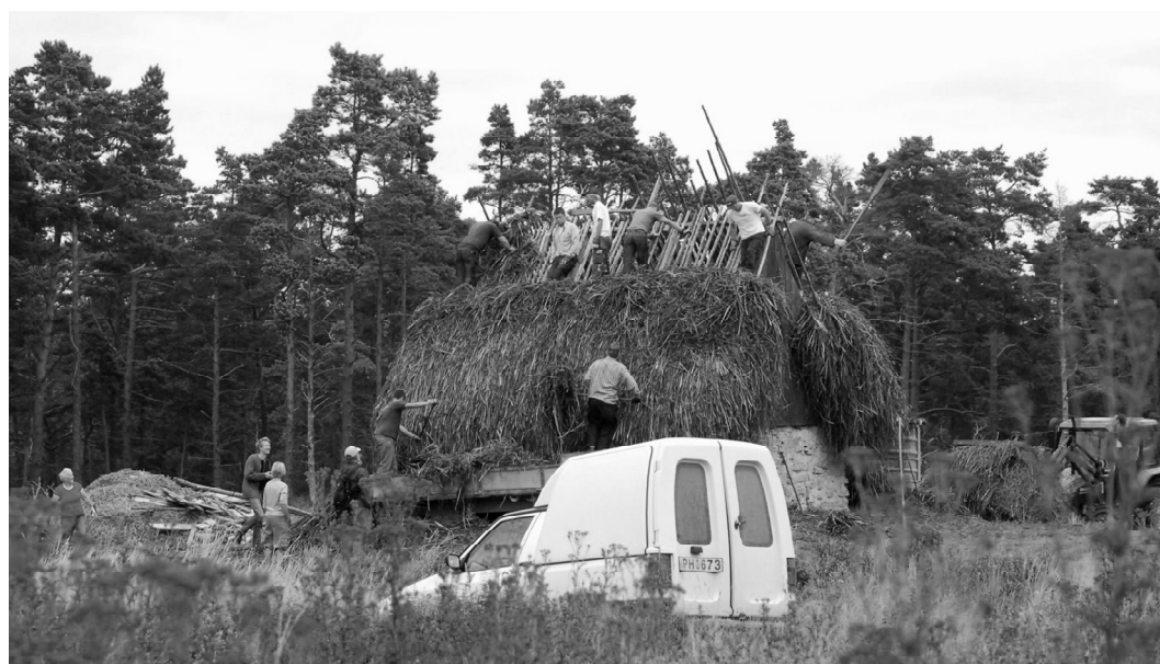
Ryc. 7. Zespołowe układanie strzechy typu agtak przez wspólnotę sąsiedzka na Gotlandii. Fig. 7. Agtak thatch laying by a neighborhood community in Gotland.

Układanie na dachu strzechy typu agtak na Gotlandii i Fårö było przedsięwzięciem wykonywanym zbiorowo w ramach całej wspólnoty sąsiedzkiej, o charakterze lokalnego festynu. Przypominało to, znaną z dużego ekranu, budowę stodół w rolniczych społecznościach anabaptystów w Pensylwanii. Któregoś ciepłego i pogodnego dnia, gdy więźba i materiał były już przygotowane, od rana, z całej okolicy (parafii) schodzili się sąsiedzi. Kiedy mężczyźni układali strzechę (ryc. 7) pod kierunkiem doświadczonych, miejscowych strzecharzy – kobiety przygotowywały wspólny posiłek rozmawiając o swoich sprawach i ciesząc się okazją do spotkania. Po całym dniu pracy siadano razem do zaimprovizowanych stołów, była muzyka i zabawa.