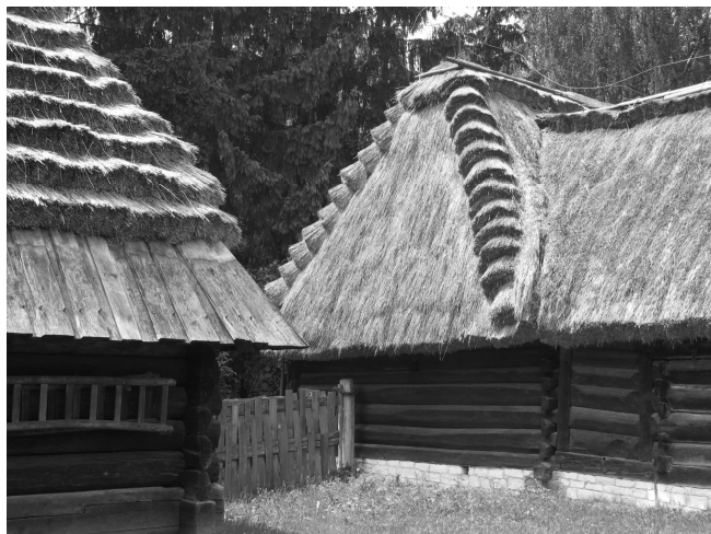
Ryc. 1. Strzechy ułożone w sposób dekoracyjny; przykłady pochodzą ze Skansenu w Lublinie.

W przeszłości strzechy były w Polsce najpopularniejszym pokryciem dachowym. Wykonywano je najczęściej ze słomy, której w każdym gospodarstwie było pod dostatkiem. Rozwinęło się wiele metod układania pokrycia, zwłaszcza w południowo-wschodniej części kraju (ryc. 1). Słomę gładko rozścielano na łąkach lub układano snopkami – knowiem w dół lub do góry. W miarę jak postępowała mechanizacja rolnictwa, coraz trudniej było o słomę, odpowiednią do krycia dachów. Maszyny łamały i międliły źdźbła, a w dodatku współcześnie rozpowszechniły się niskopienne odmiany zbóż. W tej sytuacji trzcina, jako materiał pokryciowy, zaczęła szybko wypierać słomę. Jej zaletą była i jest obecnie trwałość, ale i nieco większa odporność na ogień. Współcześnie województwo zachodniopomorskie jest przodującym producentem trzciny w Europie. W niniejszym artykule autorzy chcą pokazać przykłady strzech wykonywanych z materiałów innych niż słoma i trzcina. Pochodzą one ze skandynawskich wysp: z duńskiej wyspy Læsø w cieśninie Kattegat i ze szwedzkiej Gotlandii na morzu Bałtyckim.