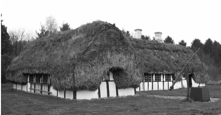
Ryc. 3. Zagroda z wyspy Læsø ze strzechą tangtag z trawy morskiej (obecnie w parku etnograficznym Sorgenfri koło Kopenhagi)

Fig. 3 Farmstead on the island of Læsø with a sea grass thatched roof (now in the Open Air Museum Sor-genfri near Copenhagen).