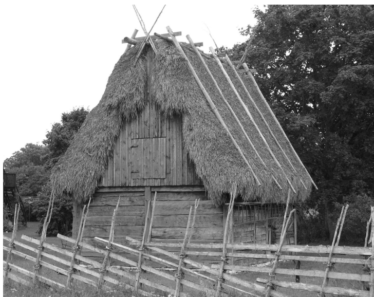
Ryc. 5. Strzecha agtak na starym budynku gospodarskim na prywatnej posesji koło miejscowości Stenkyrka.

Przechodząc do niemniej licznych budynków drewnianych, należy zauważyć, że na Gotlandii nie ma w ogóle zwyczaju malowania ścian rudobrazową farbą red Falun , tak charakterystyczną dla wiejskiego krajobrazu Szwecji i Finlandii. Wieńcowa konstrukcja ścian, powszechna na pół. Skandynawskim i po drugiej, wschodniej stronie Bałtyku, tu występuje sporadycznie. Większość obiektów drewnianych została wzniesiona w konstrukcji sumikowo-łątkowej, a rozwiązanie to na Gotlandii ma własny, lokalny charakter 2 .