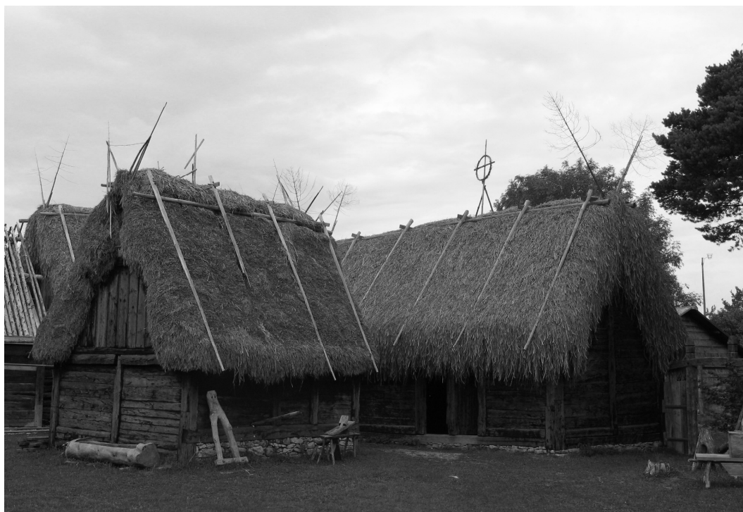
Ryc. 6. Budynki gospodarcze wyspiarskiej zagrody z XVII w. eksponowanej w gotlandzkim skansenie w Bunga.

Jak widać, wyspiarze stosowali zaskakująco szeroką paletę materiałów, zarówno do wznoszenia ścian jak i do pokrywania dachów. Obok wymienionych wyżej rozwiązań wznosili również strzechy o formach bardzo charakterystycznych dla Gotlandii i Fårö. Wykonywano je jednak nie ze słomy czy z trzciny, lecz z kłoci wiechowatej, rośliny rosnącej dziko, w płytkich stojących wodach, powszechnej w prawie całej Europie 4 . Na obu wyspach rośnie ona bujnie tworząc zwarty szuwar na płytkich, wilgotnych torfowiskach (w miejscowym dialekcie: myrarna ) i małych stawach ( tråsk ), które tworzą się tutaj samorzutnie na wapiennym podłożu.