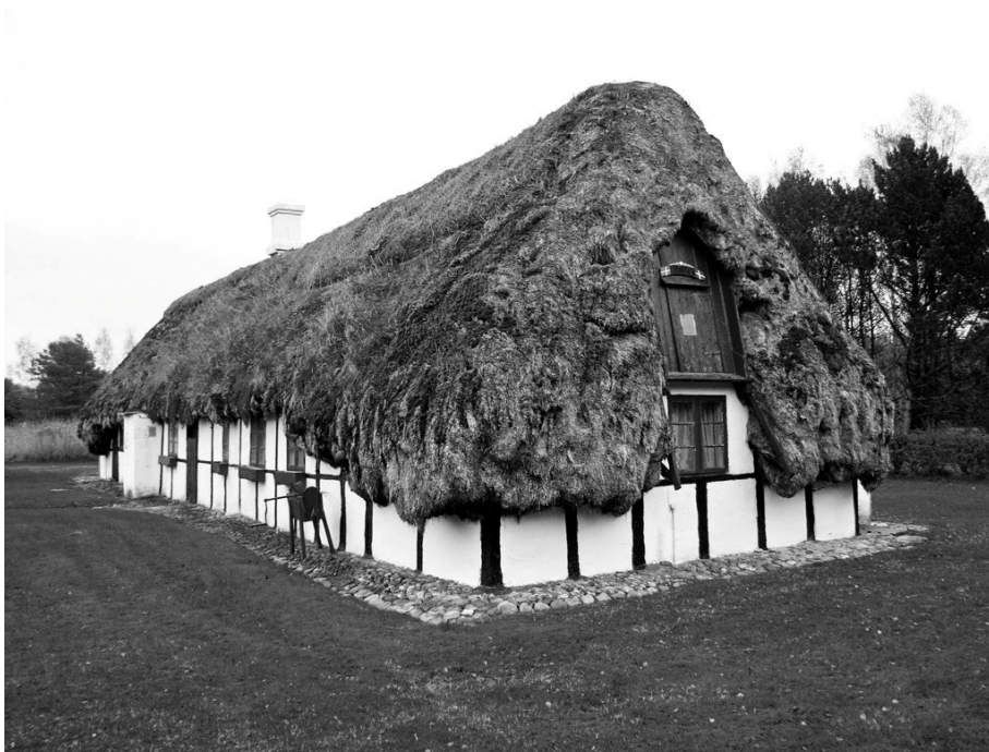
Ryc. 4. Budynek w miejscowości Østerby na Læsø

Dach typu tangtag odznacza się bardzo oryginalnym wyrazem architektonicznym. Liście trawy morskiej na dachu sklejają się; z pewnej odległości strzecha wygląda jak jedna, plastyczna masa. Wszystkie krawędzie, w tym kalenica, mają miękki, organiczny przebieg. Okap zwisa nisko, do połowy wysokości ścian zewnętrznych, jego linia jednak starannie omija wszystkie otwory okienne i drzwiowe. Ukształtowanie i na pozór duża masa okapu dają wrażenie, jakby pokrycie miękko „spływało” z dachu na ziemię (ryc. 3, 4).