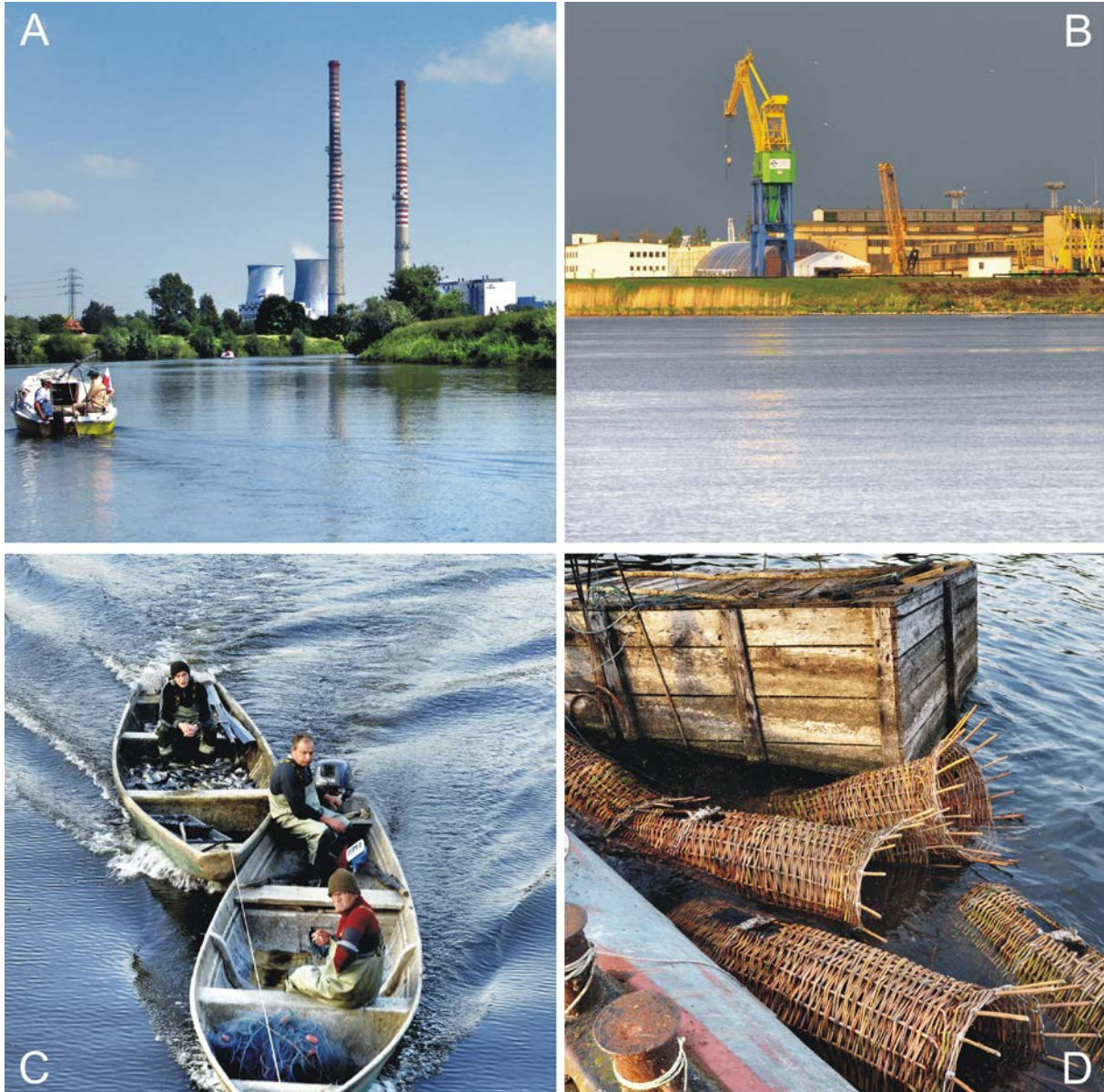
Fot. 1. Znaki sfery profanum w przestrzeni rzeki.

Sfery: sacrum i profanum mogą się czasem pokrywać, tworzyć „wyspy” czy też „zatoki”. Dzieje się tak dlatego, ponieważ sfera sacrum jest tą, która jest tworzona przez umysł człowieka. Niektórzy autorzy wydzielają zarówno „czystą” sferę sacrum (np. kościoły, cmentarze) jak i quasi-sakralną (np. kapliczki, krzyże tworzące wspomniane wyspy czy zatoki sfery sacrum w sferze profanum (Madurowicz, 2002: 64).