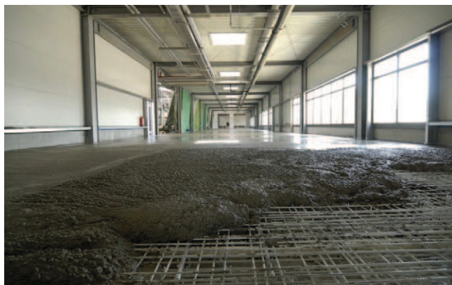
Rys. 4. Zbrojenie posadzki prętami GFRP