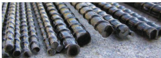
Rys. 1. Zbrojenie kompozytowe BFRP

Na rysunku 2 przedstawiono charakterystykę naprężenie-odkształcenie dla różnego rodzaju rozciąganych włókien [3]. Zgodnie z nią, cechują się one liniowo-sprężystym zachowaniem w całym zakresie wytrzymałości, która waha się w granicach od 3000 do 5000 MPa. Zbrojenie kompozytowe może występować w posta-