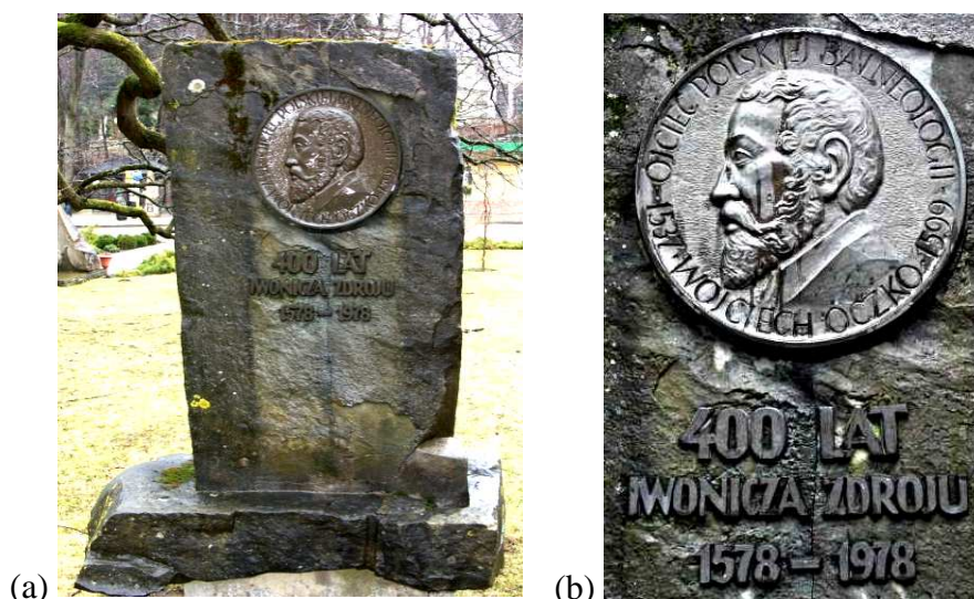
Rys. 1. (a) Pomnik Wojciecha Oczki, (b) zbliżenie medalionu i napisu