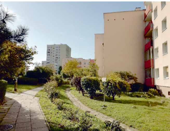
II. 1, 2. Zielone wnętrza pomiędzy blokami wybudowanymi w drugiej połowie lat 80. ubiegłego wieku III. 1, 2. Green interiors between housing blocks built in the second half of the 1980s

ings to the south of Zachodnia Street was built after 1995, with the development constantly being supplemented, its density increased by new projects. With the exception of a fragment of the area around Czerwone Maki Street and the Ruczaj-Lubostroń Park, this part of Ruczaj does not have a land development plan in effect, which typically results in urban chaos, an irrational and illegible road network and the unconstrained shaping of the area's residential architecture. The new development's distinct feature are enclosed plots, with their own green areas that are meant for use by a selected group of residents. The recreational areas at the disposal of most housing communities are small, limited to a bare minimum. They are largely comprised of playgrounds and small green squares, typically with well-maintained greenery. Gated communities block the free flow of pedestrian and vehicular traffic between each complex—with the residents forced to make shortcuts through those plots that have not yet been developed. The new part of Ruczaj suffers from a lack of extensive, freely available, public green areas, with the common spaces between buildings typically occupied by cars. The contrast between the older development from the final decades of the People's Republic of Poland and contemporary housing projects displays a considerable drop in the accessibility of green areas to residents despite an improvement of the overall standard of housing itself.