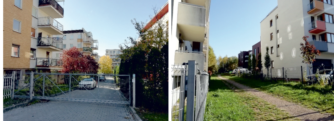
II. 3, 4. Nowa zabudowa mieszkaniowa – urządzona zieleni na terenach zamkniętych oraz nieformalne ścieżki piesze pomiędzy grodzonymi osiedlami.