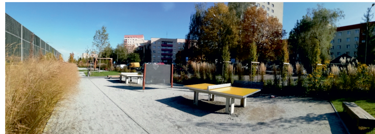
III. 5. A linear park along an acoustic screen adjoining Grota-Roweckiego Street—a new recreational area for residents.