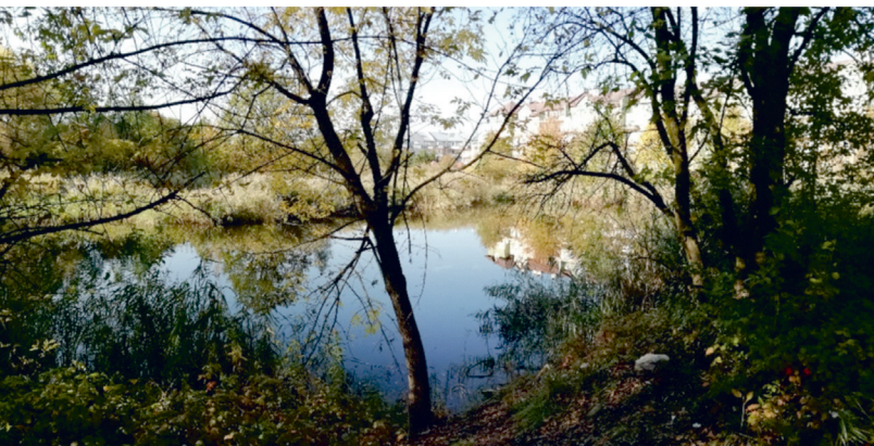
Il. 6. Zaniedbane zbiorniki wodne w Parku Ruczaj-Lubostroń / The neglected ponds in Park Ruczaj-Lubostroń