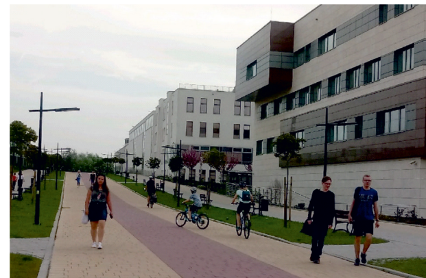
Il. 9. Miejsce dla rekreacji dla studentów UJ oraz mieszkańców Ruczaju na terenie kampusu UJ / Recreational area for the JU students and residents of Ruczaj district on the JU Campus.

the role of green areas and access to recreation can result in grassroots initiatives formed by residents, which can then be turned into projects carried out by municipal authorities. Ideas for creating pocket parks and flower meadows proposed as a part of the civic budget in areas indicated by a district's residents are a good example of this. Quite often, small, spontaneous initiatives can lead to broader transformations and improvements in the quality of urban space. The residents can also appeal to local housing communities with the intent of providing a greater access to landscaped greenery within gated communities. At the same time, planning measures taken by cities (introducing land development plans) that can regulate initiatives concerning the protection of greenery in legal terms and counter the adverse effects of the uncontrolled development of the district, are necessary.