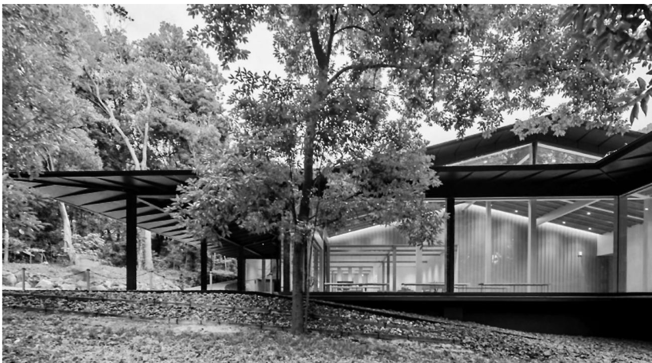
Muzeum Meiji, Tokio 2019, autor: Kengo Kuma (fot. z archiwum KKAA dzięki uprzejmości Marcina Sapety)

rezultatem. Tak więc, chociaż nadal postrzegali charakter jako cechę dominującą, nie akceptowali już go jako znaku jakiegoś naturalnego człowieka, nieskrępowanego przez społeczeństwo i swobodnie działającego w kulturowej próżni, zamiast tego zaczęli postrzegać go jako produkt specyficznej okoliczności, jako dowód autentycznej interpretacji między daną jednostką, danymi warunkami materialnymi i danym środowiskiem kulturowym. Charakter stał się jakością do wydobycia" [18]. Dziś podobne treści odnajdujemy chociażby u teoretyka architektury Christiana Norberga-Schulza, który w swej książce Mellom Ford og himmel. En bok om steder og hus (Między ziemią a niebem. Książka o miejscach i domach, 1978) tak pisze: „Aby życie mogło znaleźć miejsce, należy zrozumieć miejsce” [19]. Jego fenomenologia miejsca w dużej mierze opiera się na fenomenologii Heideggera (gdzie budowanie/mieszkanie i przebywanie jest tym samym). Norberg-Schulz przedstawia argumentację mówiącą o tym, że natura i zabudowania są połączone. Poczucie miejsca oraz jego doświadczenie przez człowieka są sterowane tą symbiozą. Tak więc wyraźna tożsamość, szczególnie i odmienna, jest ważna [20]. Jeśli przenieść tę refleksję na realizacje architektoniczne, to można stwierdzić, iż źródła tożsamości są do odnalezienia (poprzez nowe interpretacje/przekazywanie) w rodzimych tradycjach rzemieślniczych, w lokalnych materiałach lub w różnych formach inspiracji czerpanych z warunków naturalnych lub do nich dostosowanych.