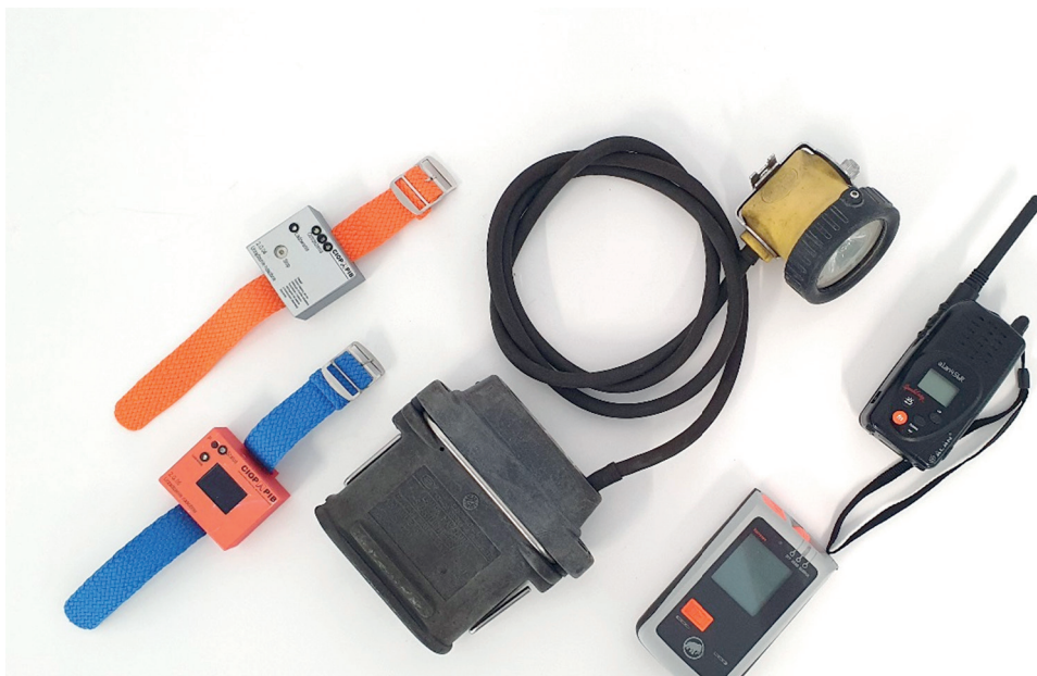
Rycina 1. Przykładowe lokalizatory nasobne: system lokalizacji wykorzystywany w górnictwie; lokalizator lawinowy używany przez narciarzy i ratowników górskich; lokalizatory wykorzystywane w przemyśle oraz radiotelefon

W każdym przypadku stosowania nasobnych lokalizatorów elektromagnetycznych konieczne jest jednak przeanalizowanie celu i okoliczności, w jakich urządzenia te mają być wykorzystywane, i dobranie do nich priorytetowych cech funkcjonalnych i konstrukcyjnych poszczególnych urządzeń (w tym rodzaju i poziomu emisji elektromagnetycznych z nasobnych lokalizatorów).