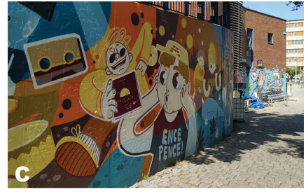
Fot. 1. Geometria ściany muralu – A – mural płaski – 2020-03, B – mural wieloboczny 2017-03, C – mural obły 2021-02