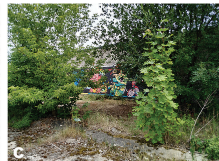
Fot. 4. Widoczność muralu – A dobrze widoczny – 2021-01, B częściowo widoczny – 2021-14, C mało widoczny – 2022-05