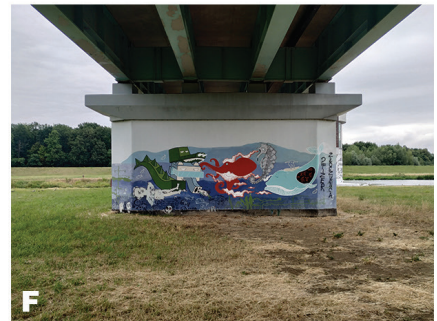
Fot. 3. Typy lokalizacji architektonicznej muralu – A – ślepa ściana – 2018-05, B – ściana z oknami/drzwiami – 2015-02, C – strefa wejściowa do budynku – 2019-03, D – brama w budynku – 2016-01, E – mur – 2013-02, F – filar mostu 2017-06