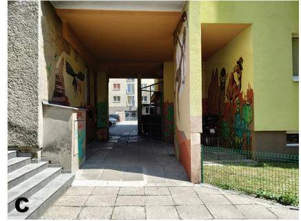
Fot. 2. Wielkość muralu względem budynku/obiektu budowlanego – A – mural na całej płaszczyźnie ściany – 2021-11, B – mural mniejszy niż płaszczyzna ściany – 2019-01, C – mural zajmujący kilka płaszczyzn – 2019-04. Fot. autora (2022 r.)