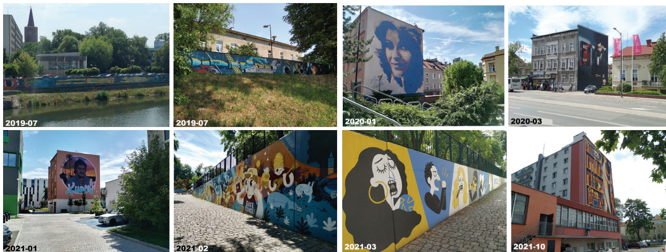
Fot. 5. Murale o największym znaczeniu w przestrzeni miejskiej w Opolu

nia urbanistycznego murali może pozwalać w przyszłości na sprawne planowanie lokalizacji kolejnych.