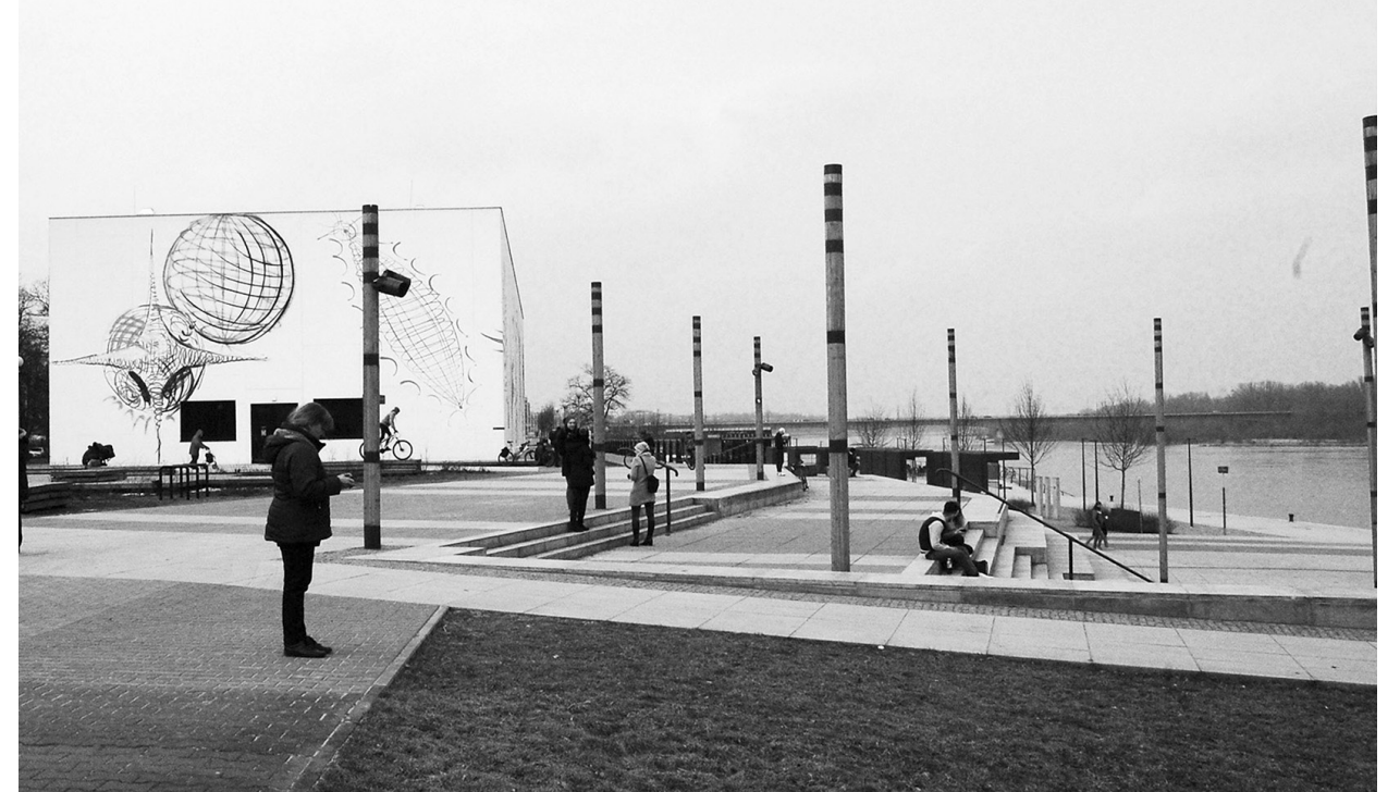
Il. 3. Warszawa, Przestrzeń publiczna bulwarów nadwiślańskich w okolicy Centrum Nauki Kopernik / Warsaw, The Vistula Boulevards public space near The Copernicus Science Centre