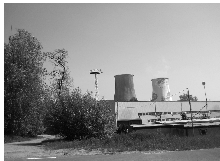
Il. 5. Kraków, Widok na elektrociepłownię Łęg, od strony ścieżki rowerowej / Krakow, A view of the Łęg thermal power plant, from the side of the boulevards bicycle path (fot. M. Bednarz) Il. 6. Kraków, Elementy infrastruktury przemysłowej elektrociepłowni Łęg / Krakow, Elements of the industrial infrastructure of the Łęg (fot. M. Bednarz)

The immediate surroundings of the zone in question is a circulation artery – Nowohucka Street along with the Nowohucki Bridge – from the west. The eastern part is adjacent to a built-up area featuring single-family residential buildings, as well as large areas of tall greenery. In the north is the industrial zone – structures belonging to EDF Polska S.A. The main tissue of the built-up area is thus composed of industrial and single-family buildings. In the north-west is Tauron Arena Krakow – a multifunctional sports and entertainment building, built near the new Stanisława Lema Street, in the south-western part of Polish Airmen Park. The Stanisław Lem Garden of Experiences was built in 2007 in its south-eastern part. To the northern side of the Łęg area is the EXPO Krakow congress and fair building. The areas described above