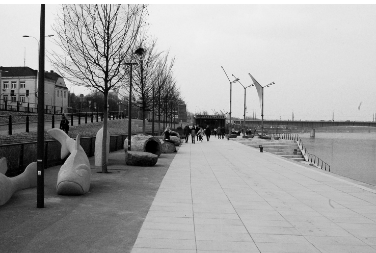
Il. 1. Warszawa, Bulwary wiślane miejsce do zabaw i rekreacji / Warsaw, The Vistula Boulevards a place for play and recreation (fot. M. Bednarz) Il. 2. Warszawa, Mała architektura, okolice Mostu Śląsko – Dąbrowskiego / Warsaw, Small architecture, Śląsko – Dąbrowski Bridge area (fot. M. Bednarz)

The waterfront areas along this section of the Vistula are an extension of the Discovery Park, and the offering of the services they provide is broad and varied. It includes: natural spaces for play and recreation (sandboxes, timber logs that have been drilled hollow), green layouts composed into the spaces of terraces (composed of plant species occurring in areas of river valleys), the so-called Living River Park and sequences of paved squares. These squares were built at the end of the urban axes of nearby streets, in the vicinity of pedestrian and bicycle pathways, running along the entire length of the boulevards. They have a recreational character and are also observation