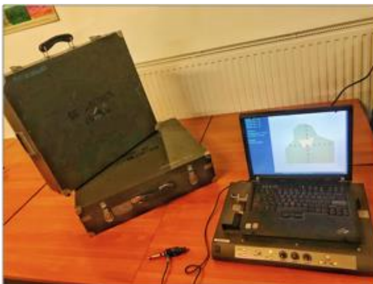
Rysunek 3. TCW-97 KGPMKmb „Cyklop” 5s przygotowany do pracy

Dodatkowo strzelnica posiada zbiór ćwiczeń wymagających od strzelca wyjątkowej koncentracji. Przykładowym zadaniem jest strzelanie do dziewięciu losowo ułożonych na ekranie kulochwytu pól liczbowych. Zadaniem osoby szkolonej jest prowadzenie celnego ognia od wartości najniższej do najwyższej. Rozwinięciem tego ćwiczenia są proste równania matematyczne pojawiające się w polach trafienia, których wynik stanowi określoną wartość. Obliczenie danego równania znajdującego się w polu pozwala na rozpoznanie celu (Rysunek 3.). Celem takiego ćwiczenia jest zwiększenie stopnia trudności trafienia.