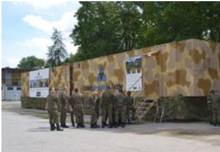
Rysunek 4. Prezentacja strzelnicy kontenerowej w Akademii Wojsk Lądowych we Wrocławiu

strzelnicy w centrum każdego miasta nie spowoduje sprzeciwu społecznego 18 oraz powinno się spotkać jedynie z dużym zainteresowaniem.