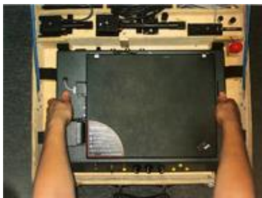
Rysunek 1. TCW-97 KGPMKmb „Cyklop” 5s w skrzyni transportowej

Powszechnie używane urządzenie w ramach szkolenia ogniowego to TCW-97 KGPMKmb „Cyklop” 5S (Rysunek 1.), który przyjął w środowisku żołnierzy zwyczajową nazwę „Cyklop”. Jest jednym najdłużej funkcjonujących symulatorów, służących do szkolenia ogniowego.