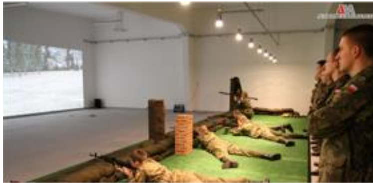
Rysunek 5. Prezentacja strzelnicy kontenerowej w Akademii Wojsk Lądowych we Wrocławiu

rokiego asortymentu jednostek broni, prowadzenia zajęć budujących umiejętność pracy w zespole np. w ramach jednego ekranu, ćwiczenie może być realizowane równocześnie przez kilku szkolonych, którzy mają możliwość stosowania różnych jednostek broni, będących na wyposażeniu drużyny, co przedstawiono na Rysunku 5.