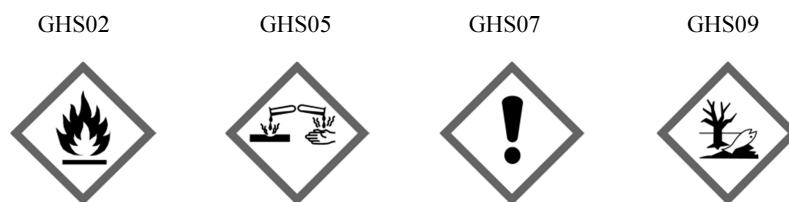
Rys. 1. Kody hasła ostrzegawczego: Dgr („Danger” – „Niebezpieczeństwo”). Piktogramy określone w rozporządzeniu WE nr 1272/2008 (CLP) mają czarny symbol na białym tle z czerwonym obramowaniem, na tyle szerokim, aby było wyraźnie widoczne