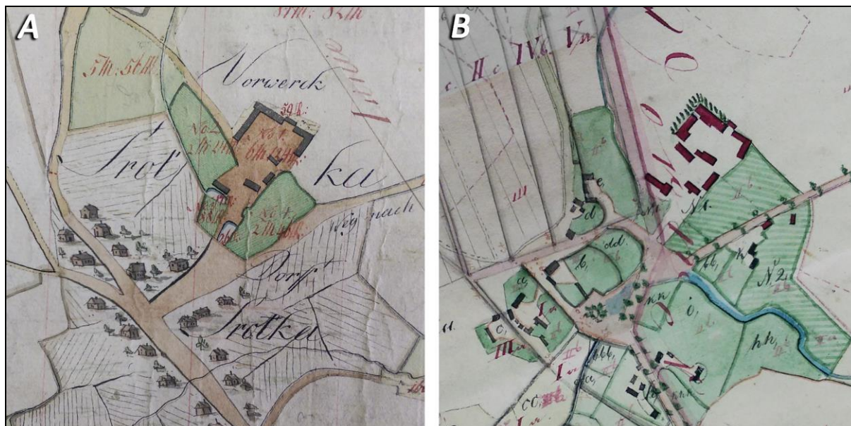
Ryc. 4. Fragmenty planów wsi Śródka (gm. Kleszczewo, pow. poznański): A – plan klasyfikacyjny z roku 1794; B – plan regulacyjny z roku 1826.

Na planach klasyfikacyjnych i administracyjno-gospodarczych, wbrew instrukcjom technicznym, zabudowa wsi była niekiedy przedstawiana w jednym kolorze. Zdarzało się także, że zabudowę rysowano w ujęciu perspektywicznym, co pozwalała na częściową identyfikację form dawnego budownictwa (ryc. 4A).