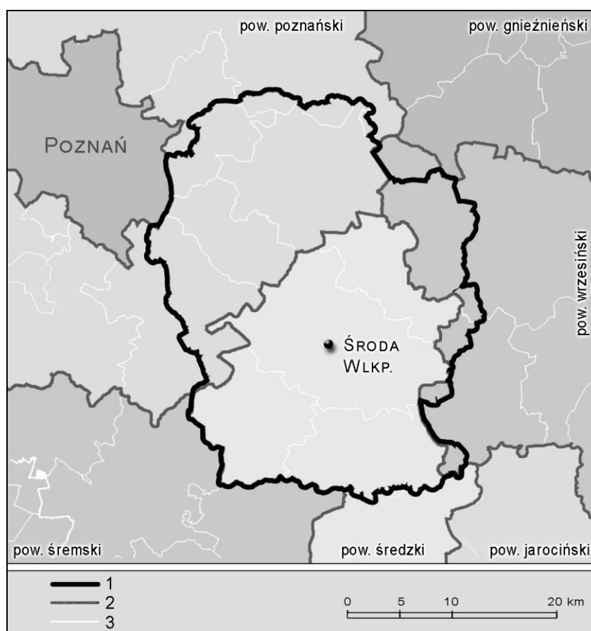
Ryc. 1. Granice historycznej ziemi średzkiej na tle współczesnych granic gmin i powiatów: 1 – granica obszaru badań, 2 – granice powiatów, 3 – granice gmin.

Badania przeprowadzono na obszarze ziemi średzkiej 10 , krainy geograficzno-historycznej, zlokalizowanej w centralnej Wielkopolsce (ryc. 1).