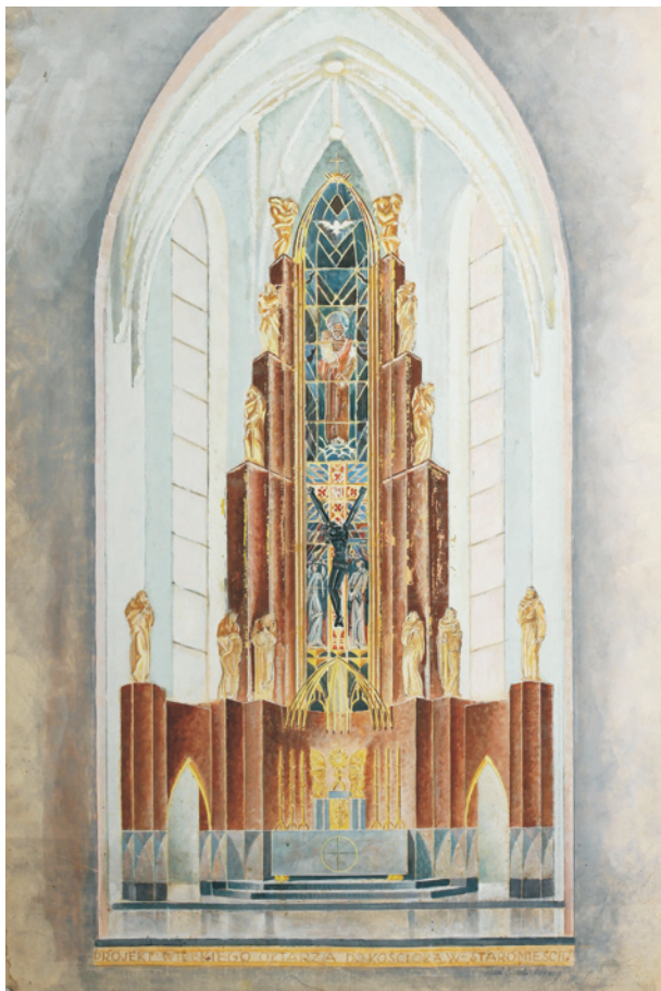
Ryc. 1. Projekt ołtarza dla kościoła na Staromieście; źródło: ze zbiorów rodziny artysty

W odniesieniu do problematyki sztuki powstającej na tzw. Ziemiach Odzyskanych po 1945 roku stajemy wobec problemu znajomości artystów i dzieł tam powstających niejako w dwóch wymiarach: ustalenia podstawowych faktów o charakterze inwentarycyjnym oraz uchwycenia specyfiki terenów przez wieki pozostających poza obszarem funkcjonowania kultury polskiej. W zakresie sztuki sakralnej problem ten dodatkowo komplikuje rekatolicyzacja większości kościołów, uprzednio ewangelickich. Ponadto trudna sytuacja administracyjna Kościoła kształtująca się wobec nacisków władz PRL, która uległa pewnej normalizacji po 1972 roku, wiązała się jednocześnie z koniecznością wznoszenia nowych kościołów: dekady lat 70. i 80. podobnie jak w całej Polsce, były okresem swoistego boomu budownictwa sakralnego.