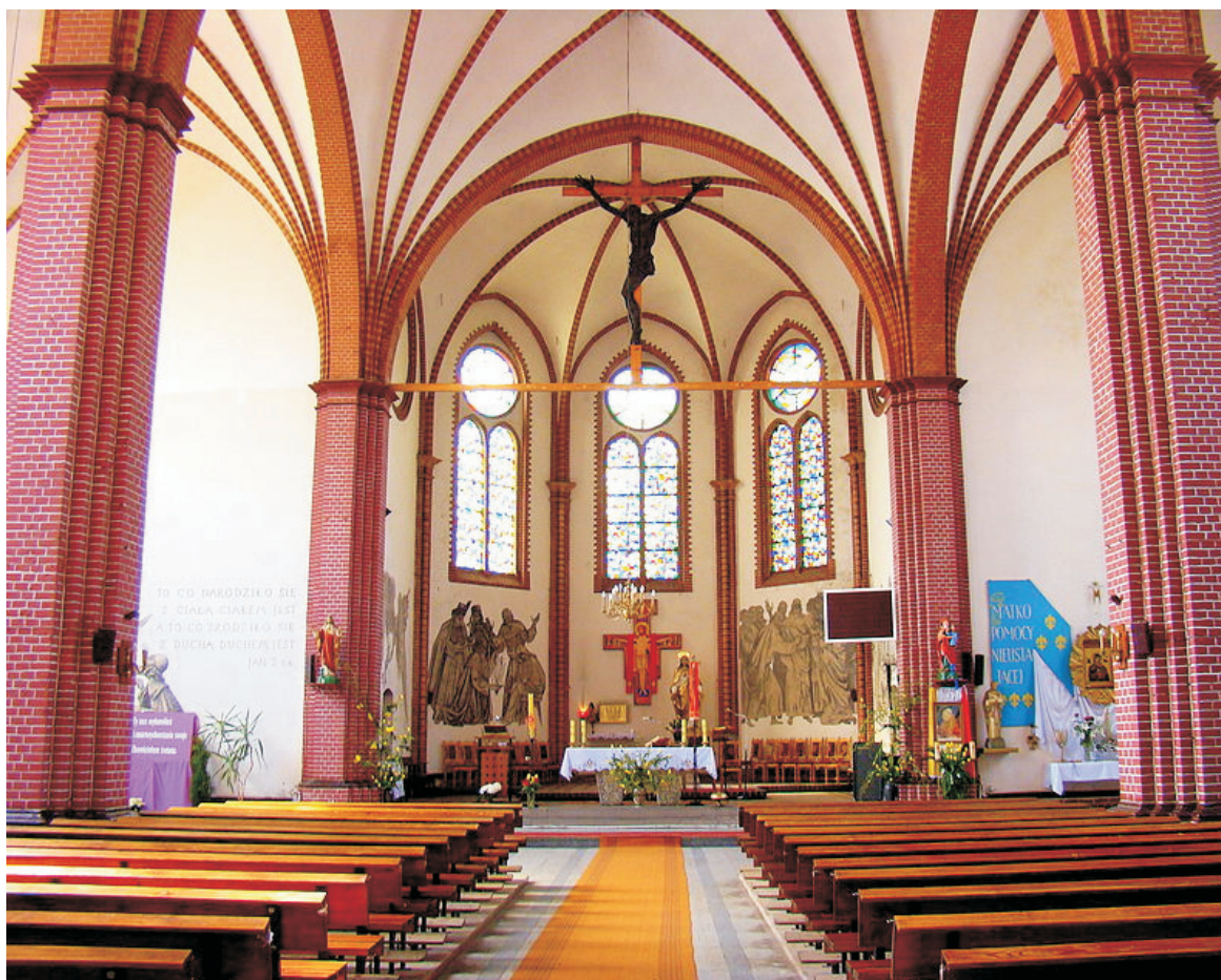
Ryc. 6. Wnętrze kościoła w Policach