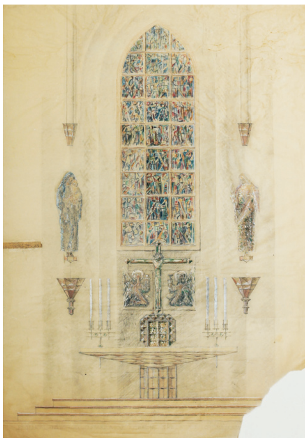
Ryc. 4. Projekt dla kościoła parafialnego w Łobezie; źródło: ze zbiorów rodziny artysty