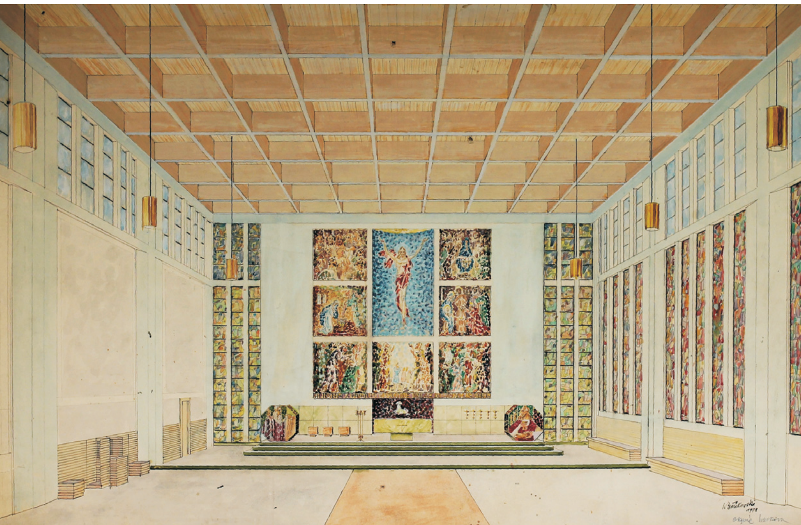
Ryc. 2. Projekt dla kościoła św. Franciszka z Asyżu na Okęciu w Warszawie

ne na międzynarodowych targach w Dreźnie, Paryżu, Budapeszcie i Sztokholmie. Jednym z najpiękniejszych dzieł artysty z tego czasu jest głowa Fryderyka Chopina wykonana w marmurze z Carrary (obecnie w zbiorach Muzeum Chopina w Warszawie). W Poznaniu wykonał w 1950 r. ołtarz główny w kościele św. Michała Archanioła.