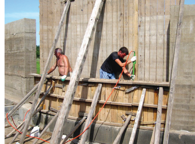
Il. 5. Wykonywanie ściany z ziemi ubijanej w szalunkach, 2007. Ściana krzywoliniowa, szalunki z desek pionowych. / Making a rammed earth wall in formwork, 2007. Wall is curved, formwork out of vertical planks.

The thermal balance was prepared in accordance with the algorithm contained in Annex G to Polish Standard PN-B-02025:1999 (item 3), supplemented by a module calculating heat losses from floor at ground level (according to ITB Instruction (item 5)). The calculations were made using the UbE computer software, which was based on this algorithm. The efficiency of the use of solar heat (veranda and south-eastern windows) obtained by the building was calculated using the PREFEN 1.0 program owned by the Faculty of Architecture of the Warsaw University of Technology (the calculations were made by arch. Paulina Gawrońska from the sub department of Building Physics ).