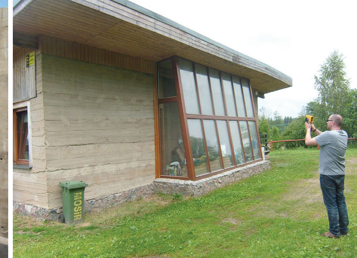
Il. 6. Pomiar zewnętrzny przy pomocy kamery termowizyjnej 2017 / External measurement with thermovision camera, 2017

– Bilans cieplny sporządzono zgodnie z algorytmem zawartym w załączniku G do Polskiej Normy PN-B-02025:1999 /pkt 3/, uzupełnionym o człon obliczający straty ciepła przez posadzkę parteru posadowioną na gruncie (wg Instrukcji ITB /pkt 5/). Obliczenia przeprowadzono przy pomocy programu komputerowego UbE, opartego na wspomnianym algorytmie.