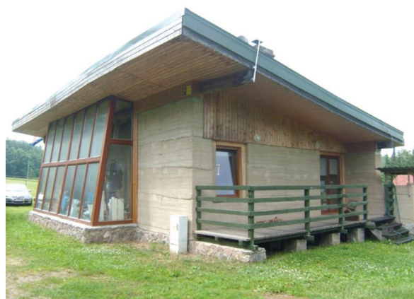
Il. 1. Widok budynku od strony północnej. (fot. J. Górski) / View of the building from the northern side. (photo: J. Górski) Il. 2. Widok budynku od strony południowo-wschodniej. (fot. J. Górski) / View of the building from the southeast. (photo: J. Górski)