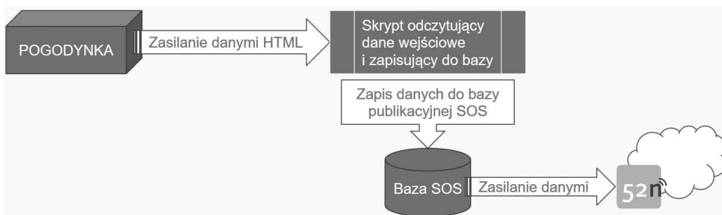
Rysunek 3. Podłączenie danych źródłowych do usługi SOS

Ogólny schemat przepływu danych z serwisu POGODYNKA do usługi SOS pokazano na rysunku 3. Założono, iż dane pochodzące ze strony www od razu będą zapisywane w bazie publikacyjnej (Baza SOS), której schemat został opracowany zgodnie z modelem bazy danych SOS zaproponowanym przez 52°North.