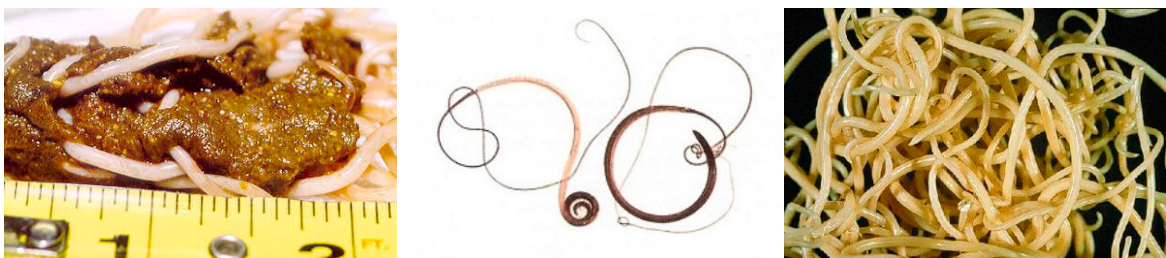
Fot. 1. Przykłady pasożytów, których jaja występują w osadach ściekowych. Od lewej: Glista ludzka, włosogłówka oraz glista psia