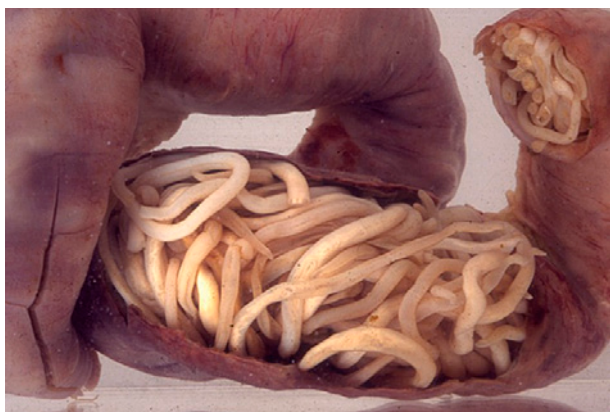
Fot. 2. Usunięty chirurgicznie wycinek jelita 3-letniego dziecka z Afryki, w którym doszło do zablokowania glistami.

1,2 mld ludzi, z czego w samych tylko Chinach połowa tej liczby. [4] Jednakże problem pasożytów dotyczy nie tylko mieszkańców biednych krajów, ale całej populacji światowej. Jeżeli chodzi o obecność jaj pasożytów jelitowych w osadach ściekowych, wcale nie trzeba szukać daleko. Jako przykład mogą posłużyć badania wykonane w Polsce.