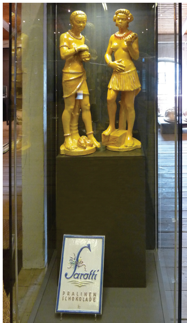
Il. 3. Galanteria ceramiczna wykonana przez Richard Blumenfeld A.G. dla produkującej czekoladki firmy Sarotti