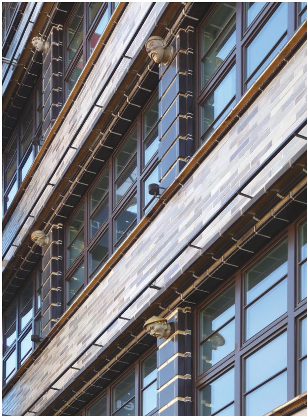
Il. 9. Fragment zachodniej fasady Renomy. Stan w 2010 r., po pracach konserwatorskich