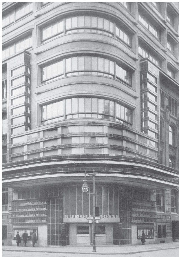
Il. 4. Rudolf-Mosse-Haus (Berlin, Schützenstraße 25) przebudowany w latach 1921–1923 przez Ericha Mendelsohna. Ceramiczne lico fasady wykonane przez Richard Blumenfeld A.G. [za: 5, s. 87]

Fig. 4. Rudolf-Mosse-Haus (Berlin, Schützenstraße 25) remodeled in 1921–1923 by Erich Mendelsohn. The ceramic facade made by Richard Blumenfeld A.G. [after: 5, p. 87]