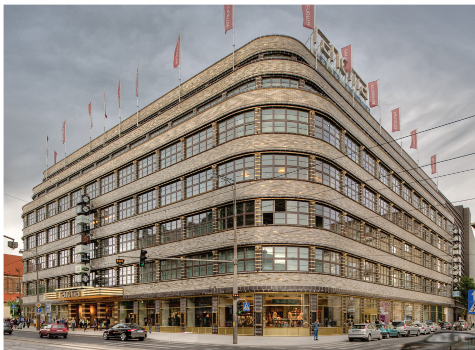
Fig. 10. Renoma department store in Wrocław. View from the south. After restoration and extension conducted in 2006–2009

Rudolfa Fernholza. Monumentalnej, ekspresyjnej architektury tego gmachu, o klinkierowych elewacjach ozdobionych posągami rzeźbiarza Felixa Kupscha, towarzyszą bogato dekorowane szkliwioną ceramiką wnętrza, których autorstwo jest nieznan 14 .