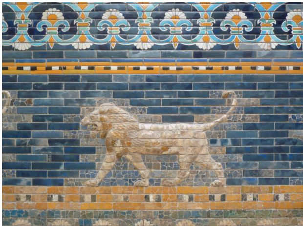
Il. 6. Fragment babilońskiej bramy Isztar w Muzeum Pergamońskim w Berlinie, zrekonstruowanej w latach 1929–1930 z udziałem Richard Blumenfeld A.G. Stan z 2013 r.

Fig. 6. Fragment of the Ishtar Gate in Babylon at the Pergamon Museum in Berlin reconstructed in 1929–1930 with the participation of Richard Blumenfeld A.G. As of 2013