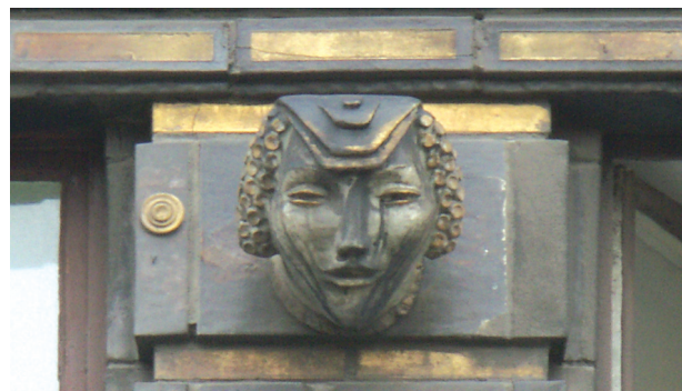
Il. 8. Głowa kobieca wykonana przez Ulricha Nitschkego, jedna ze 156 rzeźb znajdujących się na fasadach domu handlowego Renoma we Wrocławiu. Stan z 2005 r., przed konserwacją

Warto dodać, że we Wrocławiu zachował się jeszcze jeden gmach, w którym zastosowano oryginalną ceramikę budowlaną wykonaną przez Blumenfelda. Jest to wzmiankowany w katalogu do wystawy, wzniesiony w latach 1925–1927 kompleks Landesfinanzamt , dziś