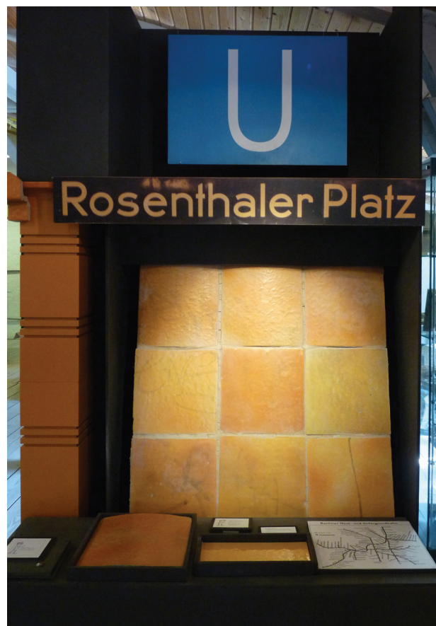
Il. 5. Ekspozycja kształtek ze stacji U-bahn Rosenthaler Platz w Berlinie wykonanych w 1927 r. przez Richard Blumenfeld A.G.

Fig. 4. Rudolf-Mosse-Haus (Berlin, Schützenstraße 25) remodeled in 1921–1923 by Erich Mendelsohn. The ceramic facade made by Richard Blumenfeld A.G. [after: 5, p. 87]