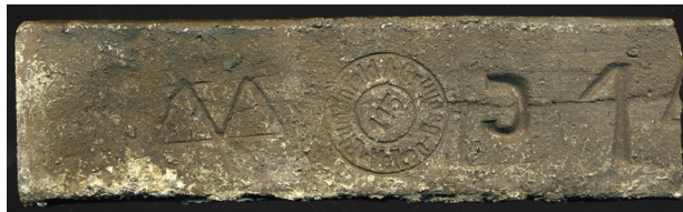
Il. 7. Stempel Richard Blumenfeld A.G. odkryty na awersie klinkierowej kształtki zdjętej z fasady domu handlowego Renoma we Wrocławiu (dawny Warenhaus Wertheim ) podczas rewaloryzacji przeprowadzonej w latach 2007–2009 r.

Fig. 7. Stamp of Richard Blumenfeld A.G. found on the face of a clinker tile disassembled from the facade of Renoma department store in Wrocław (former Warenhaus Wertheim ) during the restoration conducted in 2007–2009