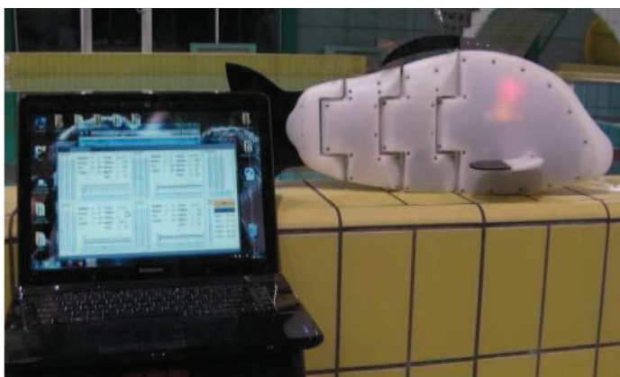
Fig. 2. Technology demonstrator for a bio-mimetic underwater vehicle with harmonic drive.

Considering the high effectiveness of technological development within the UMS programme, the Ministry of National Defence in liaison with the Polish Naval Academy and the Technological University in Cracow have initiated works on an extension of the programme's technical scope with a project known as SABUVIS (a swarm of bio-mimetic underwater vehicles for underwater intelligence surveillance and reconnaissance). Its target goal is to construct heterogeneous, autonomous, bio-mimetic underwater vehicles equipped with proper sensors as well as communication and navigation devices. The vehicles would be used in the realisation of selected operational scenarios related to underwater reconnaissance, including the identification and neutralization of floating mines. The implementation of the SABUVIS project is particularly significant, as it would be the first in the history of Poland's contribution to the EDA's works where it could act as the appointed leader. It would also be a project of a novel character as it concerns a concept, so far not investigated by the EDA, regarding the application of unmanned underwater vehicles with a harmonic drive in the execution of complex reconnaissance and combat missions.