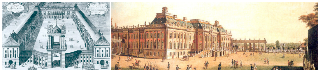
Рис. 4. Потсдамский городской дворец эпохи Фридриха II

Все работы по переустройству дворца были завершены Кнобельсдорфом в 1752 году (рис. 4), а со смертью Фридриха II завершилась эпоха прусского просвещения.