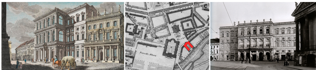
Рис. 3. Дворец Барберини, арх. К. фон Гонтардт. Гравюра (ок. 1780 г.); план площади; фотография фасада (1907 г.)

Архитектором Карлом фон Гонтардом рядом с городским дворцом был сооружен дворец Барберини, также ориентированный своим главным фасадом на центральную площадь. Архитектурным образцом при строительстве дворца Барберини служило Палаццо Помпеи архитектора Микеле Санмикеле (рис. 3).