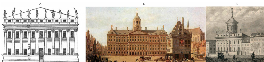
Рис. 2. А. Палаццо Ангарано арх. Палладио; Б. Амстердамская ратуша арх. Якоб ван Кампен; В. Здание ратуши арх. К. Буманн и К. Л. Хильдебрандт

Этап восхождения на престол наследника Фридриха Вильгельма I - Фридриха II Великого стал ключевым в истории дворцовых изменений. При нем произошли главные преобразования Потсдамского дворца и его окрестностей [2]. С 1748 года традиционная фахверковая застройка территорий близ городского дворца сменилась роскошными особняками, чей помпезный образ был навеян иностранными образцами архитектурного искусства. Выбор был сделан преимущественно в пользу итальянского ренессанса и маньеризма, однако классическая английская и французская архитектура, которые так нравились Фридриху II, также были адаптированы к условиям Потсдама. По плану архитекторов К. Буманна и К. Л. Хильдебрандта территорию Старого рынка, перестроили в виде «римской площади» с центральным обелиском. Вместе с расположенным на ней городским дворцом было сформировано историческое ядро города. На месте старой городской ратуши соорудили новое здание. Шаблонами для его исполнения послужили Палаццо Ангарано итальянского архитектора Палладио (рис. 2А) и здание Амстердамской ратуши Якоба ван Кампена (рис. 2Б). Карниз и купол здания были украшены скульптурами, главной из которых была статуя Атласа. Средний ризалит поддерживался восемью коринфскими колоннами (рис. 2В).