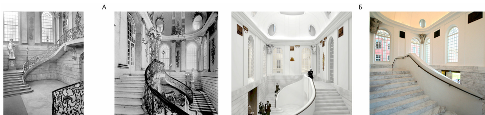
Рис. 6. А. Старая лестница Кнобельсдорфа; Б. Восстановленная лестница П. Кулька