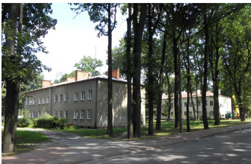
Fig 1. Old city – Modrzewiowa street, modern condition.

railway in Nałęczów) [4, p. 168] and was created the warehouse of building material [5, p. 6]. The settlement was situated on north side of factory, on forest lands, along the road led from Rozalin to Poniatowa cottage. The natural watercourse (Poniatówka river) between them was preserved. The 22 buildings were build perpendicularly to Modrzewiowa street and 11th of November street until the September in 1939. The buildings were intended for families of technical staff and clerks [4, p. 316]. It may be assumed that between the buildings, and as along the road, the stand of trees was left, which created the private sphere for whole district and the citizens of individual blocks. It has survived until nowadays and is commonly known as “Old District” (fig.1).