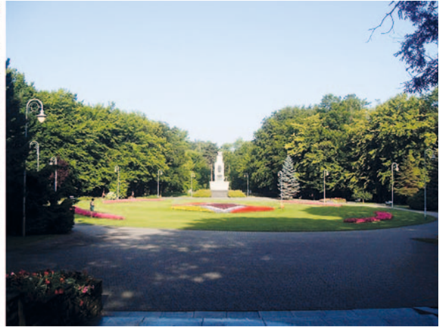
Il. 2. Współczesny stan terenów po przedwojennych miniaturowych ogrodach zoologicznych: a) Park Miejski im. F. Kachla w Bytomiu, b) Park Miejski im. T. Kościuszki w Katowicach