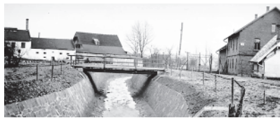
Ryc.4. Widok uregulowanego potoku Bysinka z zabudowaniami fabryki kapeluszy oraz browaru, Muzeum Regionalne w Myślenicach, sygn.2853