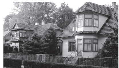
Ryc.10. Wille zdrojowe przy ulicy Słowackiego