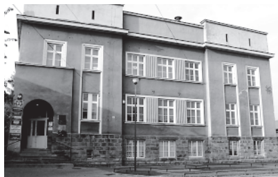
Ryc.7. Budynek Kasy Chorych – elewacja główna