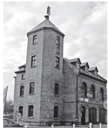
Ryc.6. Budynek straży pożarnej – narożnik południowo-wschodni