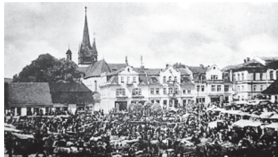
Ryc.8. Rynek myślenicki w trakcie poniedziałkowego targu, koniec lat 30. XX wieku. Na pierwszym planie kamienice autorstwa J.Hołuja juniora.