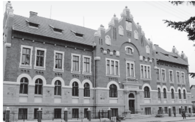
Ryc.5. Budynek sądu rejonowego – elewacja frontowa odnowiona w 2007 roku