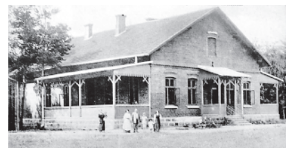
Ryc. 9. „Dom Zdrojowy” – elewacja południowa, reprodukcja z pocztówki z lat 20. XX wieku. Muzeum Regionalne w Myślenicach, sygn. 393/Ah