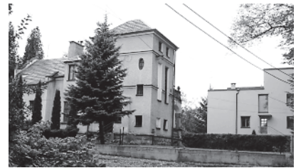
Ryc.11. Wille przedwojenne rodziny Hołujów