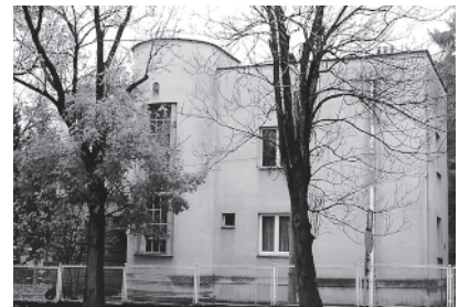
Ryc.12. Modernistyczna willa przy ul. Wyspiańskiego