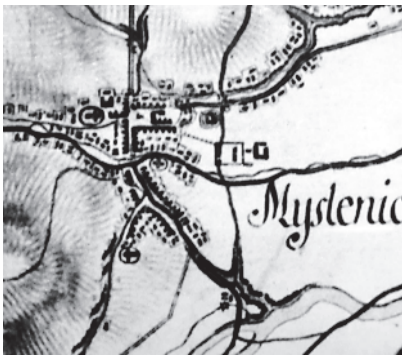
Ryc. 1. Mapa Miega, fragment z mapą Myślenic, 1779-82, fotokopia. Pracownia Słownika Geograficznego Ziemi Polski w Średniowieczu, PAN O/Kraków