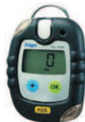
Rys. 3. Elektroniczny analizator gazów Fig. 3. Electronic gas analyser

Niezależnie od posiadanych środków ochrony indywidualnej, każdy pracownik po stwierdzeniu stężenia siarkowodoru o wartości powyżej 7 ppm, ma obowiązek bezwarunkowego wycofania się z miejsca zagrożenia do miejsca bezpiecznego. Doświadczenia w zakresie prowadzenia eksploatacji złoża w oddziale G-63, przy występowaniu zagrożenia gazami szkodliwymi, potwierdzają, że wprowadzony indywidualny monitoring stężeń siarkowodoru, stanowi najbardziej niezawodny sposób zapewnienia bezpieczeństwa pracownikom.