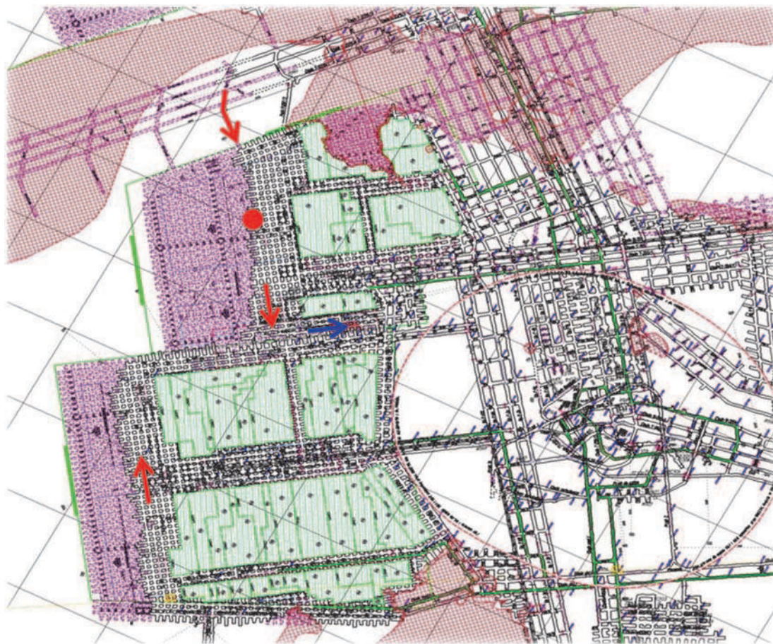
Rys. 1. Szkic wyrobisk pola F, piętra F1W i F2W z zaznaczeniem kierunków przepływu powietrza oraz lokalizacji wstrząsu klasy E7

W czasie dalszego postępu frontu eksploatacyjnego piętra F2W i sukcesywnie prowadzonej likwidacji przestrzeni wybranej, emanacje siarkowodoru stwierdzano na pasie przyzobowym. Wartości stwierdzanych stężeń siarkowodoru elektronicznymi analizatorami gazów wynosiły od 7 do 13 ppm. W celu zabezpieczenia załogi na froncie eksploatacyjnym przed ewentualną możliwością przepływu gazów ze zrobów, przystąpiono do szczelnego tamowania kolejnych pasów likwidowanej przestrzeni oraz przedłużenia „tunele wentylacyjnego”. Dotychczas stwierdzane emanacje gazowe