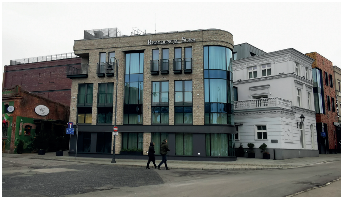
Il. 11. Rybi Rynek – widok w kierunku zachodnim na kompleks hotelowo-usługowy „Łaźnie Miejskie” w bloku zabudowy pomiędzy ul. Jatki, Grodzką a Rybim Rynkiem

Działania od lat 80. XX wieku związane z wprowadzaniem nowej architektury do przestrzeni historycznej zostały określone przez prof. Lubocką-Hoffmann jako retrowersja – metoda zapoczątkowana przez nią w Elblągu. Nowe rozwiązanie polegało na zachowaniu dawnego układu przestrzennego, projektowaniu kamienic o tradycyjnych gabarytach i podziałach elewacji, które otrzymały wyraźnie współczesne formy architektoniczne, nawiązujące jednocześnie do lokalnej tradycji, zharmonizowane z zabytkowymi budowlami i otoczeniem 29 . Bydgoski projekt BRE Banku został nagrodzony w konkursach architektonicznych (m.in. SARP) i stworzył drogę nowej architektury w historycznym centrum. Jak każda realizacja w przestrzeni publicznej spotkał się on też z krytyką – w widoku prostopadłym z drugiego brzegu monumentalna prosta bryła może sprawiać wrażenie nieco przytłaczające, natomiast w widoku na nabrzeże z głównej osi komunikacyjnej (mostu, przy ulicy Mostowej) budynki te stanowią kompozycyjnie interesujące domknięcie panoramy (il. 10). Wykorzystana okładzina ceramiczna z naturalnymi odcieniami i widocznym kruszywem także jest dobrej jakości.