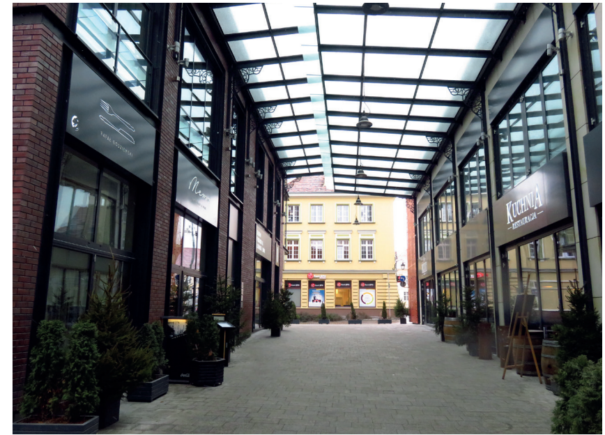
Il. 8. Odbudowana ul. Jatki w Bydgoszczy, widok w kierunku południowym – Starego Rynku

Wcześniejsza część nowej, przeznaczonej na cele restauracyjne zabudowy ulicy Mostowej (2006–2007), to dość zachowawcze projekty o historyzującej formie, z zestawem uproszczonych motywów nowożytnych. Jako tzw. architektura tła miały służyć harmonijnemu widokowi ulicy z zachowanymi w pierzei zachodniej XIX-wiecznymi kamienicami, tak aby z kolei wyeksponować ich wartości artystyczne. Zabudowa ta może być jednak odczytywana jako historyczna. Z kolei utrzymane w nowoczesnych formach kamienice drugiej części bloku – wspólnego z rynkiem (2013) – pełnią inną funkcję: stanowią nowy akcent architektoniczny eksponowany od strony rynku i wlotu ul. Mostowej.