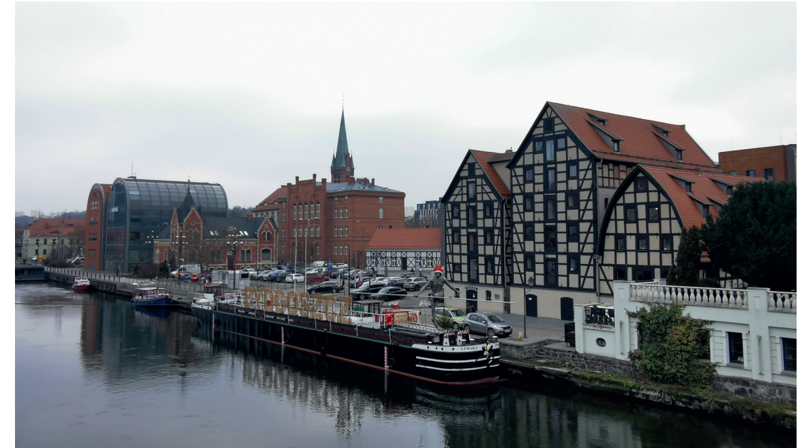
Il. 10. Panorama Bydgoszczy od strony północnego nabrzeża Brdy, widok w kierunku południowo-wschodnim na spichrze, zabytkowy Pałac Lloyd'a i budynki BRE Banku