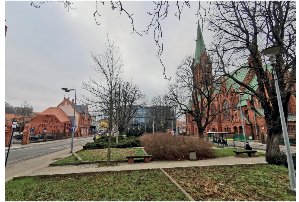
Il. 15. Plac Kościeleckich w Bydgoszczy, widok z wnętrza placu od strony wschodniej. Po lewej (południowej) stronie rozbudowany zabytkowy budynek KPCK, w centrum biurowiec Immobile, po prawej (północnej) zabytkowy kościół Jezuitów, dawniej ewangelicki (fot. K. Zimna-Kawecka, 2023 r.)

Choć sama architektura jest doceniana ze względu na technologię i estetykę, m.in. kamienne okładziny elewacji, część odbiorców razi zastosowana forma i kubatura blokowa, przeskalowana względem miejsca, kubatura o fasadzie kontrastującej kolorem i materiałem z ceglаныmi budynkami wokół placu (nawet stacja benzynowa ma częściowo ceramiczną okładzinę). Według projektantów budynek harmonizuje się z historyczną przestrzenią, gdyż szklana elewacja zapewnia odbicie kościoła, a nawiązaniem do historycznej zabudowy jest zróżnicowanie płaszczyzn elewacji poprzez wprowadzenie wnęk i wykuszy.