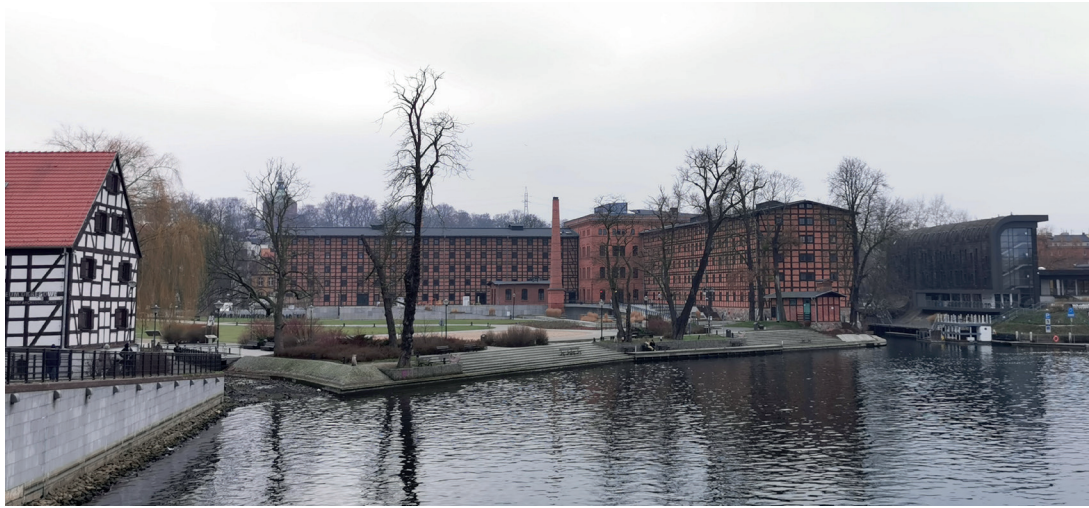
Il. 13. Widok na Wyspę Młyńską od strony Brdy w kierunku południowo-zachodnim. W centrum zrewitalizowany zabytkowy kompleks Młynów Rothera

placu i stanowi jednocześnie formę dialogu z przeszłością – materiał, kubatura i bryła pozwalają na właściwą ekspozycję zabytku (proj. Pracownia Ingraf – arch. Anna Pawlicka-Zabojszcz) 38 . Kolejna realizacja to biurowiec klasy A, prezentujący nowoczesne, ekologiczne rozwiązania konstrukcyjno-funkcjonalne (2016–2018, CDF Architektki).