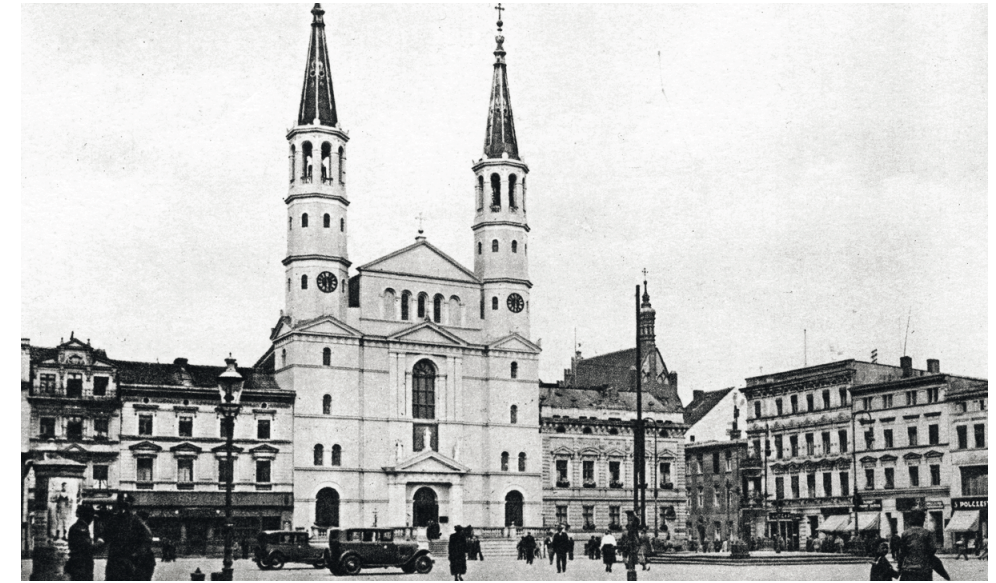
Il. 3. Stary Rynek w Bydgoszczy – pierzeja zachodnia przed zniszczeniem, widok w kierunku północno-zachodnim, przed 1935 r.

plac Kościeleckich, ulica Grodzka) ilustruje wszystkie etapy odbudowy miast historycznych w kontekście zagospodarowania przestrzennego wyszczególnione przez prof. Marię Lubocką-Hoffmann 7 : od odbudowy historycznej, poprzez odbudowę zharmonizowaną i modernizm, po retrowersję, a także współczesną fazę, w której wyróżnić można kilka nurtów, w tym rekonstrukcję i realizacje postmodernistyczne, będące interpretacją wartości genius loci miasta, mające wpisywać się w historyczną tkankę miejską 8 .