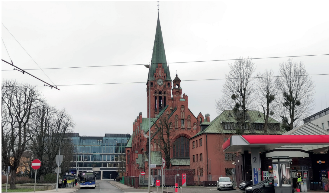
Il. 14. Plac Kościeleckich w Bydgoszczy, widok od strony wschodniej (fot. K. Zimna-Kawecka, 2023 r.)