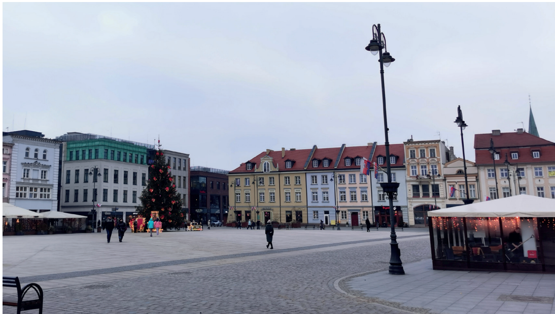
Il. 6. Stary Rynek w Bydgoszczy, widok w kierunku północno-wschodnim na odbudowaną część pierzei północnej i wschodniej

W części wschodniej pierzeję odbudowano już w latach 1953–1956 w stylu historycznym, bez odniesienia do zabudowy istniejącej w tym miejscu wcześniej (il. 6). Wprowadzanie do przestrzeni miejskiej elementów i motywów klasycznych mających nadać jej cechy polskiego krajobrazu było tendencją ogólnopolską. Budynki tworzą zwartą blokową bryłę, wyraźnie wskazującą na inny czas powstania niż pozostała część pierzei. Przed dwudziestoma laty przemalowano fasady w dość intensywne kolory, co podkreśliło artykulację elewacji i osłabiło oddziaływanie blokowej bryły. Sama koncepcja odbudowy może już uchodzić za nawarstwienie historyczne, wskazujące na działalność powojennej „polskiej szkoły konserwatorskiej” 15 . Jednak szare tynki z białymi stolarkami typowymi dla tego czasu, zachowane jeszcze od strony elewacji podwórzowych, społecznie byłyby dziś nie do przyjęcia. Warto jednak w przyszłości zaplanować rewaloryzację zabudowy według koncepcji podobnej do zastosowanej w procesie rewitalizacji ulic Ogarnej czy Szerokiej w Gdańsku 16 .