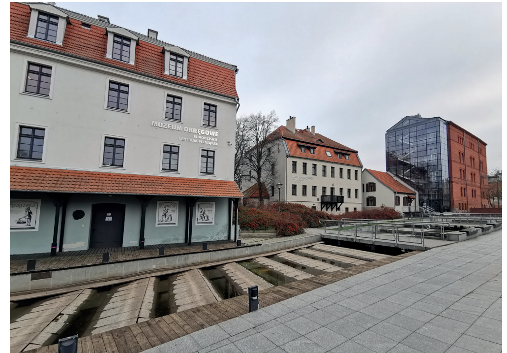
Il. 12. Zrewitalizowane budynki Muzeum Okręgowego w Bydgoszczy na Wyspie Młyńskiej od strony Międzywodzia, widok w kierunku południowo-wschodnim (fot. K. Zimna-Kawecka, 2023 r.)

Rewitalizacji zostały odrestaurowane z zachowaniem układu funkcjonalno-przestrzennego i przeznaczone na siedzibę Parku Kultury – inkubatora aktywności dla przyszłych placówek edukacyjnych, kulturalnych i rozrywkowych 37 (il. 13).