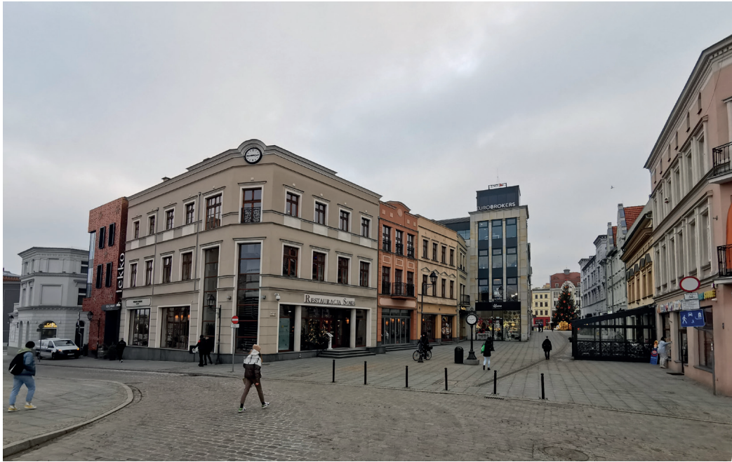
Il. 7. Ul. Mostowa w Bydgoszczy – widok na odbudowaną pierzeję wschodnią, w kierunku południowym – Starego Rynku; po prawej (zachodniej) stronie zachowane historyczne kamienice

zagospodarowania przestrzennego z uwzględnieniem uwag konserwatora wojewódzkiego 22 . „Kaskadę” rozebrano w latach 2011–2012, a pierzeję północną odbudowano w latach 2013–2014 (GM Architekci), przy czym dostosowano kubaturę nowych budynków do sąsiedniej zabudowy i zachowano klasyczny podział artykulacji elewacji, tak jak to postulowano ponad 40 lat temu (il. 4). Do budynków istniejących wcześniej nowe nawiązują proporcjami szerokości i w ogólnym zarysie wysokości, nie naśladując form historycznych harmonijnie wpisują się w charakter rynku 23 .