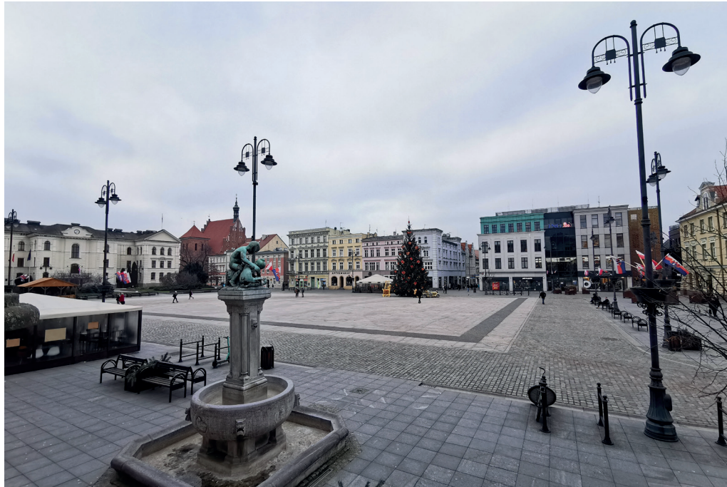
Il. 4. Stary Rynek w Bydgoszczy, widok w kierunku północno-zachodnim. Po prawej (zachodniej) stronie odbudowana część północnej pierzei rynku, po lewej (zachodniej) dawny budynek kolegium jezuickiego (fot. K. Zimna-Kawecka, 2023 r.)

Pierwotny projekt z 2009 roku (GM Architekci) kilkakrotnie zmieniano z powodu braku funduszy. Pierwsza wersja kładła nacisk na jakość detalu rozwiązań i materiałów oraz uwzględniała podziemną trasę turystyczną 10 (il. 5). W wyniku badań archeologicznych zrezygnowano z odsłonięcia i zabezpieczenia szkleniem relikwów murów kościoła i ratusza stojącego kiedyś na środku rynku. Przeważały techniczne trudności z utrzymaniem stabilnych warunków klimatycznych, co wiązało się z wbudowaniem urządzeń w zabytkowe fundamenty, oraz wysokie koszty takiej inwestycji. Z tych samych powodów zrezygnowano z fontanny 11 . Służby konserwatorskie początkowo nie wyraziły zgody na nasadzenia drzew, zwracając uwagę, że wcześniej rynek nie był zadrzewiony, a nowe nasadzenia mogłyby spowodować uszkodzenia relikwów budowli. W wyniku oczekiwań społecznych uzgodniono jednak pojedyncze nasadzenia dwóch drzew w narożach wschodnich, miasto nie zdecydowało się jednak na większą liczbę nasadzeń. Nawierzchnię wyłożono kamiennymi płytami, ciemniejszym odcieniem, dzięki czemu wyznaczono obrys dawnego ratusza.