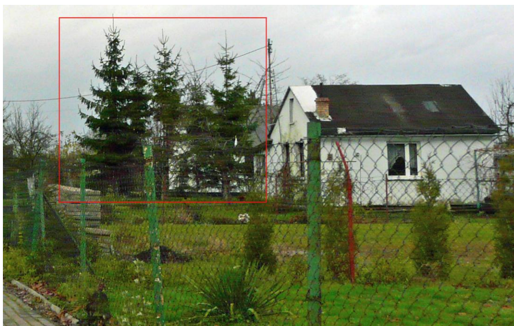
Ryc. 2 Zdjęcie pokazuje zbyt wysoką zieleń posadzoną na granicy między działkami zabudowy jednorodzinnej.

minimalną wielkość powierzchni biologicznie czynnej oraz wyposażenie w odpowiednie place, natomiast nie reguluje się spraw dotyczących nasadzeń. Przepisy, do których można się odnieść, dotyczące wszelkich nasadzeń na działce, również w zabudowie jednorodzinnej, znajdują się w Kodeksie cywilnym, którego między innymi Art. 144 przedstawia się następująco: Właściciel nieruchomości powinien przy wykonywaniu swego prawa powstrzymać się od działań, które by zakłócały korzystanie z nieruchomości sąsiednich ponad przeciętną miarę, wynikającą ze społeczno-gospodarczego przeznaczenia nieruchomości i stosunków miejscowych. Zacytowany artykuł stosowany jest w orzecznictwie sądowym między innymi do spraw dotyczących nasadzeń w szczególności krzewów i drzew. Zieleń posadzona zbyt blisko granicy działki może przeszkadzać właścicielom sąsiedniej działki poprzez zacielenie ogrodu, okien domu lub przesłanianie ciekawego krajobrazu. Może to być powód, żeby usunąć zieloną przesłonę. Problem może się pojawić, jeżeli jest to zieleń, którą można usuwać tylko za zgodą, o której jest mowa w Ustawie o ochronie przyrody. 3