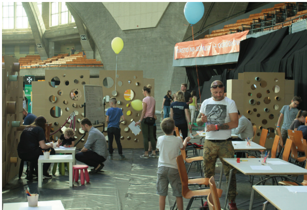
Il. 5. „Mała szkoła architektury” – warsztaty projektowe