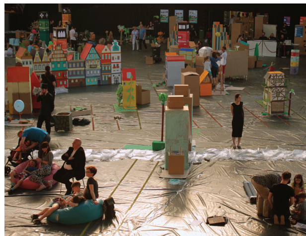
Il. 4. Miasto w trakcie budowy

Fig. 4. The city under construction