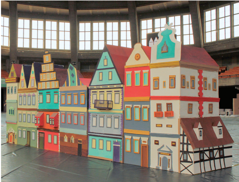
Il. 3. „Starówka” przygotowana przez studentów Wydziału Architektury PWr