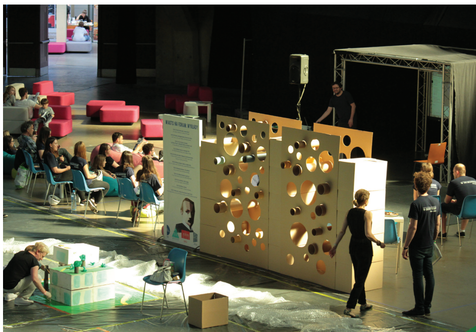
II. 6. Wykłady zaproszonych gości