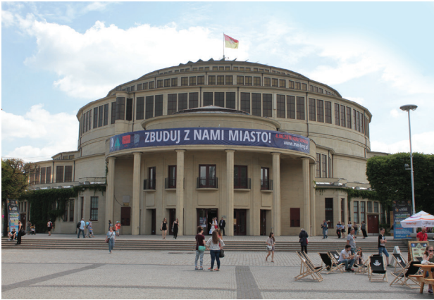
Il. 1. Dni Architektury Makska Berga i akcja „Zbuduj z nami miasto!” w Hali Stulecia