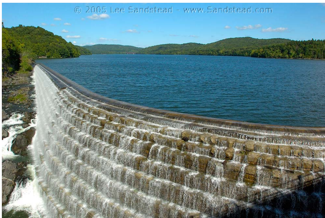
Fig. 4. The New Croton Dam (USA). [14]

Ryc. 2. The New Croton Dam (USA). [14]