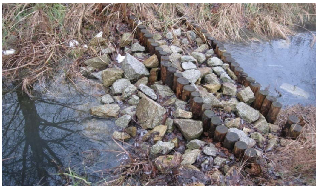
Fig. 1. Water threshold in the forest area. Ryc. 1. Próg wodny na obszarze leśnym.

The technology-nature conflict is exacerbated even more when hydrotechnic facilities enter the highest protected areas - for instance in Europe, Natura 2000 sites or even National Parks. It is forbidden to undertake activities that may have a significant negative impact on the protection objectives of a Natura 2000 site, regardless of the geographic location of the site itself. Exceptions are investments resulting from overriding public interest, unless proven alternative solutions are available and environmental compensation is ensured. Unfortunately, the term "overriding public interest" is a transformative notion and its final definition is not constructed. Often, in spite of the above mentioned conditions, interference in natural valuable areas raises numerous controversies on the part of non-governmental environmental organizations. [10] In the meantime, water structures for active protection on natural valuable objects are often a separate group of hydrotechnical constructions. Their characteristic features include a design that allows the free movement of aquatic living organisms and a form that integrates into the natural landscape. Obviously, the materials used should be as natural as possible (wood, stone, fascine) and "environmentally friendly". [4] An example of a construction using wood and natural materials is the splash dam (hydrotechnical building used to periodically improve the flow of a river or stream, now rarely seen). [12] (Fig.1)