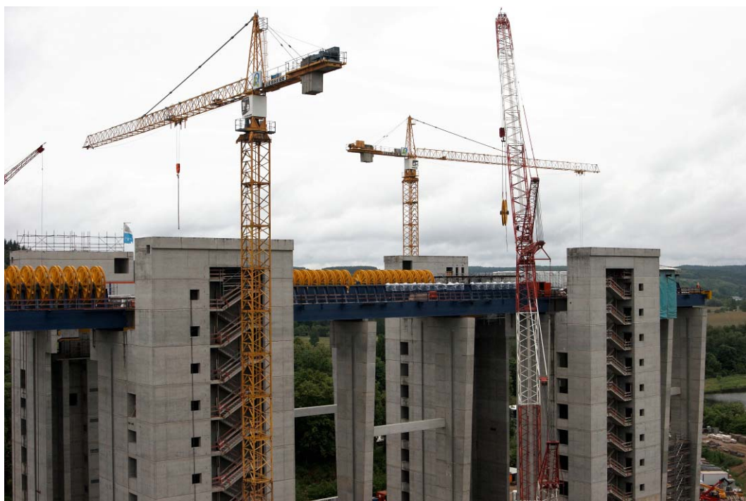
Fig. 2. Construction of the new Niederfinov Boat Lift.

Ryc. 2. Budowa nowej podnośni statków w Niederfinow.