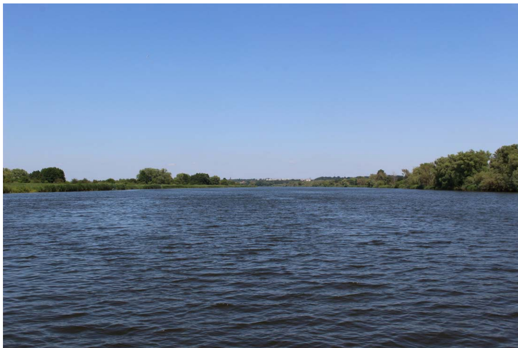
Fig. 5. Eastern Odra River at 715 km.

Ryc. 3. Odra Wschodnia na 715 km biegu rzeki.