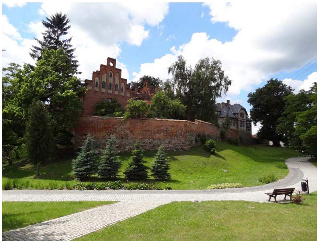
Ryc. 1. Stan istniejący zamku w Sztumie.

Pierwszą kartę dziejów pisanych Sztumu wypełnia relacja krzyżackiego kronikarza Piotra z Dusburga z drugiej wyprawy krzyżowej do Pomezanii w 1236 r. którą dowodził margrabia Miśni-Henryk III. Dusurg pisze: W ziemi pomezkańskiej znajdował się niegdyś obszar zwany Rezją, w którym mieszkali sławni i doświadczeni wojownicy. Na nich to – wspomniany książę – przykładając rękę do pługu i nie oglądając się do tyłu – mężnie natarł, niszcząc raz po raz grabieżą, ogniem i wielkim rozlewem krwi niewiernych. Zamek ich położony w pobliżu rzeki Mokrej oraz wszelkie umocnienia, jakie mieli w tym miejscu, które nazywa się Sztum, i jakie mieli w pobliżu Postolina, w pobliżu Prabut i Obrzymowa, w pobliżu jeziora Družno i Wielbarka, przemocną zbyły i obróciwszy w perzynę zrównał z ziemią, a niewiernych zabił lub wziął do niewoli. Lecz jak dzielnie i jak mężnie wspomniany margrabia jakby lew, który przed niczym się nie cofa, pokonał wymienione plemiona, tego nikt nie może dokładnie opisać ani słowami, ani piórem. A tak był wobec nich nieustępliwy na wojnie, że poddały się one wierze i braciom. I tym prawom i wolnościami, jakie wówczas in nadano, podlegali także inni nowo nawróceni [7, s. 53].