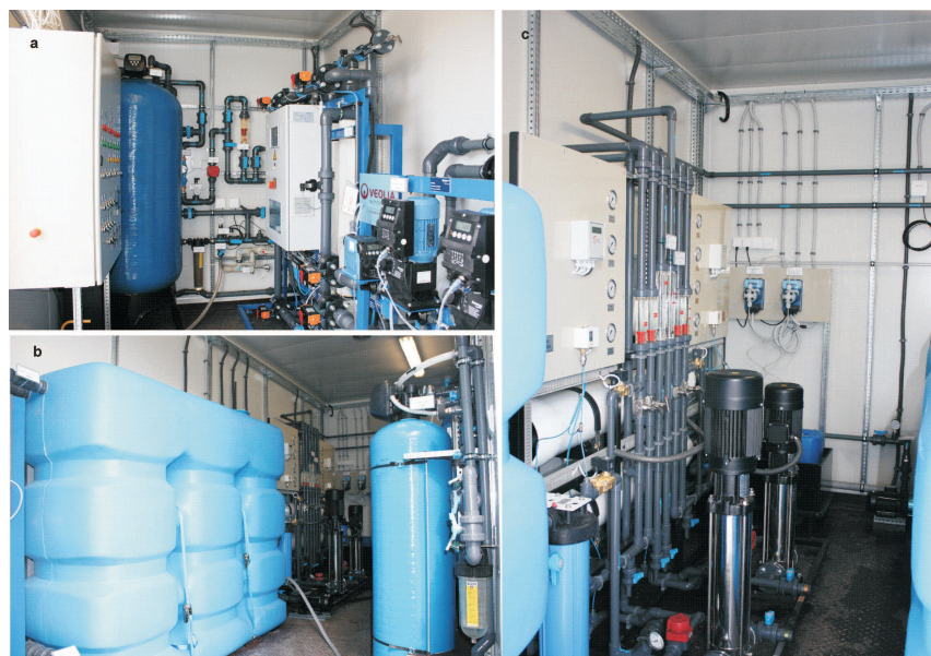
Rys. 3. Pilotowa instalacja odsalania wód termalnych w IGSMiE PAN: (a) wstępne uzdatnianie wody (filtr mechaniczny, stacja odżelaziania, moduł ultrafiltracji), (b) zbiornik pośredni przed stacją RO oraz uzdatnianie końcowe – po prawej (mineralizacja), (c) dwustopniowy system odwróconej osmozy z pompami wysokociśnieniowymi (centralnie) (Tomaszewska, Bodzek 2012)