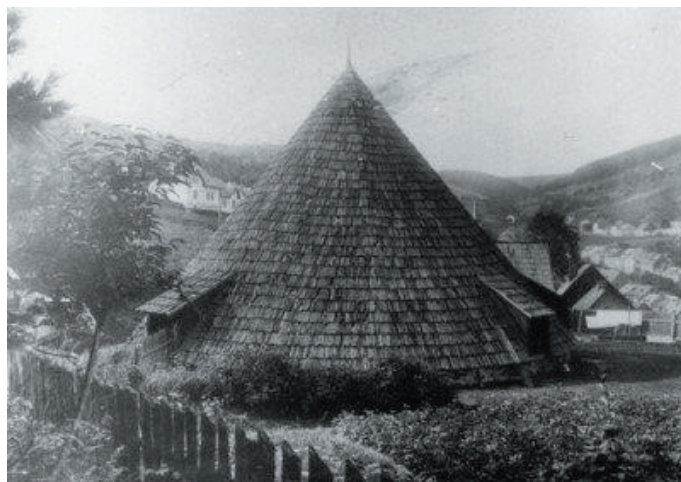
Obr. 2. Nejstarší místní žentour na Schottenbergu Fig. 2. Whim gin on the hill Schottenberg

gen verligenen gengen vnd massen ahne schadenn. Kucks der Kirche, ein Kucks Sanct Anna“), tedy krátce po prohlášení Matze Busche a Jindřicha z Könnertitz o stavu stříbrnosných žil. Není ovšem jasné, kde byla tato propůjčka Schreynerovi udělena. Na základě srovnání možných údajů z dochovaných knih a Mathesiových pamětí je možné předpokládat, že prvním větším podnikem byly práce při Alte Funtgrube , Staré nálezná jámě.