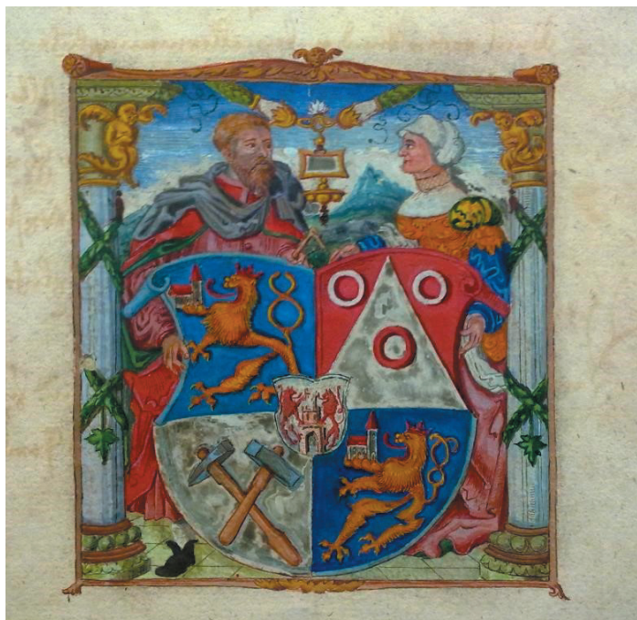
Obr. 3. Privilegium krále Ferdinanda – Fol. 5, detail–městský znak Jáchymova (Praha, Národní archiv, VBÚ Jáchymov, sign. Jáchymov 1520)