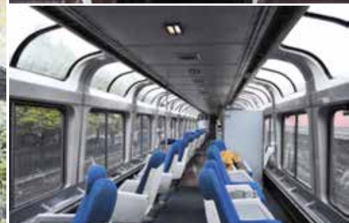
Fot. 8. Southwest Chief [1, 14, 15]