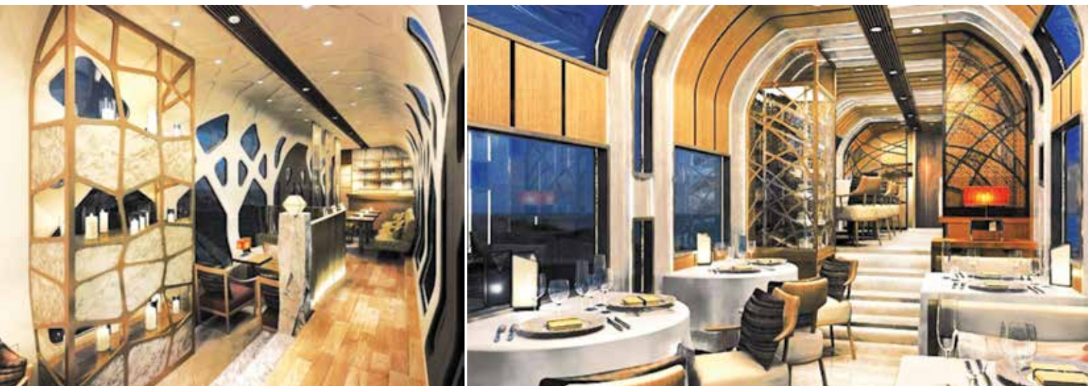
Fot. 12. Dwupoziomowy apartament w pociągu Train Cruise [13]

Wagony tego pociągu będą wyposażone w najnowocześniejsze urządzenia techniczne, zapewniające eliminację hałasu, drgań, bocznych przechyłów i maksymalne bezpieczeństwo.