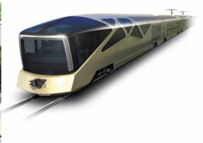
Fot. 11. Wizualizacja luksusowego przeszklonego wagonu w pociągu Train Cruise [13]