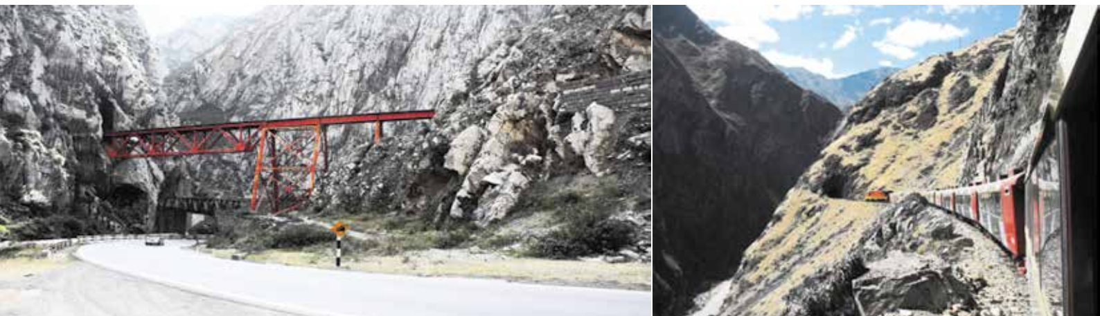
Fot. 10. Tunele i mosty na trasie Kolei Transandyjskiej [15]

ki Południowej, poza Chile, miał miejsce niespotykany na innych kontynentach głęboki regres kolei pasażerskiej, który spowodował likwidację większości linii, a niejednokrotnie zapaść całego i tak nieefektywnego systemu pasażerskiego transportu kolejowego, projektowanego w wielu krajach bez podstawowej analizy techniczno-ekonomicznej i terytorialnych uwarunkowań. Niskie standardy tych linii w krótkim czasie przestały spełniać oczekiwania, nie dziwi zatem, że w latach 70. zamknięto większość dalekobieżnych i podmiejskich połączeń, a niektóre przeformowano wyłącznie dla ruchu towarowego.