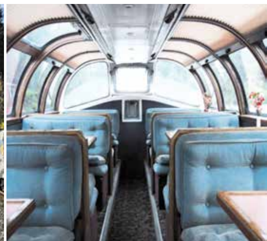
Fot. 9. The Canadian na trasie [23]