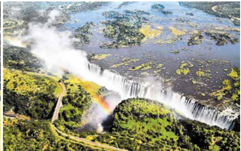
Fot. 4. Trasa kolejowa obok Wodospadów Wiktorii [17]