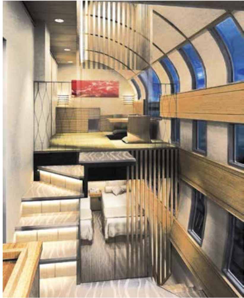
Fot. 11. Dwupoziomowy apartament w pociągu Train Cruise [13]

Aktualne uwarunkowania wynikające zarówno z coraz wyższego poziomu technicznego taboru, jak i rosnących potrzeb zróżnicowanych grup społecznych powodują, że w modelu podaży luksusowych usług kolejowych następują istotne zmiany. Prawdopodobny trend tych zmian można zaobserwować w projekcie pociągu „Train Cruise” japońskiej firmy East Japan Railway. Koszt budowy tego pociągu, przeznaczonego dla najbogatszych klientów, składającego się z 6 wysokiej klasy apartamentów