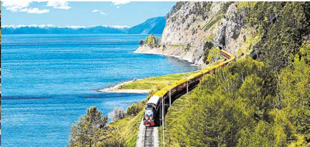
Fot. 6. Kolej Transyberyjska [16, 15]

o szczegóły obsługi, wystroju i kulinariów w atmosferze towarzyskiej i turystycznej przygody. Nie dziwi zatem, że w elitarnych pociągach Azji czas przejazdu ma najmniejsze znaczenie. W sąsiedztwie najwyższych gór spotyka się rozległe pustynie, tundrę i dżunglę. W tej części świata istnieją diametralnie odmienne różnice kulturowe, religijne i narodowościowe, a także kontrasty ekonomiczne odzwierciedlające zarówno dbałość o tradycję, jak i pośpiech w dążeniu do osiągnięcia zdobyczy współczesnego postępu i cywilizacji.