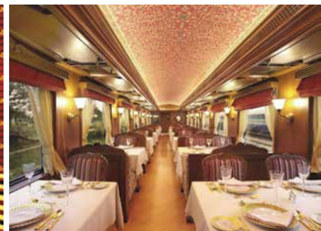
Fot. 7. Maharajas Express [11]