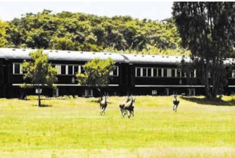
Fot. 3. Pociąg Pride of Africa na trasie [19]

Na czas ekskluzywnej podróży pasażerowie mają do dyspozycji gustownie i funkcjonalnie urządzone przedziały sypialne,