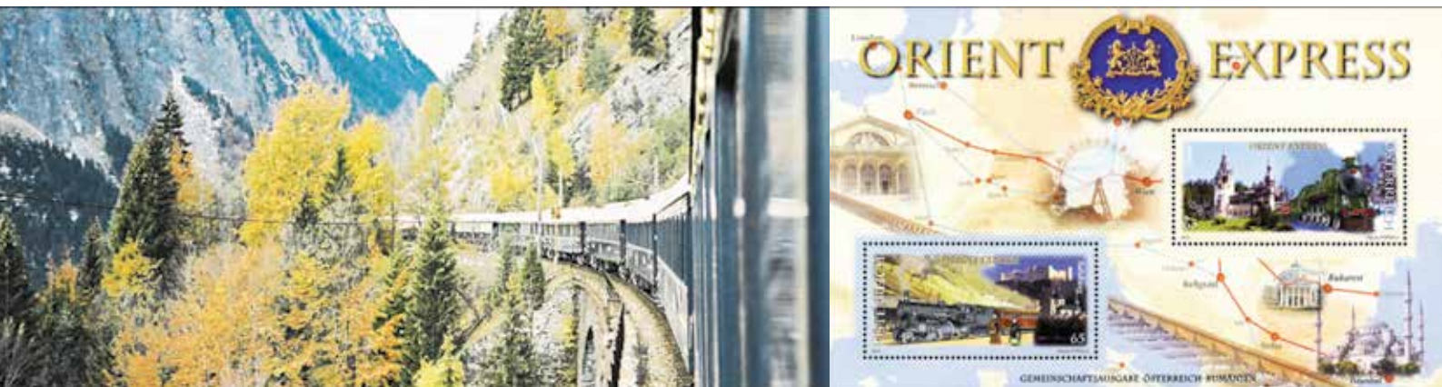
Fot. 2. Najstynniejszy pociąg w Europie Orient Express [22, 25]

Firmy przewoźnicze zarządzające luksusowymi pociągami szczególną uwagę zwracają na zakres usług podstawowych, których nie da się pominąć ponieważ zabezpieczają niezbędne funkcje związane z wygodą i stopniem satysfakcji z podróżowania. Na to wskazują przykłady omawiane w poprzednich edycjach zrealizowanego cyklu, z których wynika, że w tym segmencie kolejowego transportu trwa nasilona i systematyczna rywalizacja, dotycząca głównie jakości zaspokajania oczekiwań podróżnych poprzez wprowadzenie coraz bardziej zaskakujących innowacji służących poprawie komfortu w przedziałach, estetyki, jakości oraz poszerzenia zakresu doznań kulinarnych. Nie dziwi zatem, że w najbardziej ekskluzywnych pociągach świata poza przedziałami stanowiącymi najwyższej klasy apartamenty sypialne funkcjonują wagony restauracyjne, sale spotkań towarzyskich i biznesowych, bary, sklepy oraz gabinety odnowy biologicznej.