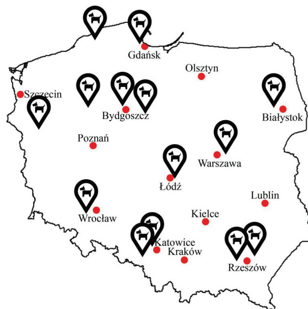
Il. 1. Rozmieszczenie grzebowisk dla zwierząt w Polsce (oprac. A. Myślińska)