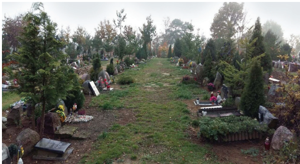
Il. 2. Grzebowisko Brzozowa Przystań, Mochle (źródło: http://brzozowaprzystan.pl/wp-content/uploads/2015/11/cmentarz_dla_zwierza_bydgoszcz-3.jpg [data dostępu: 7.08.2017])

Fig. 2. Pet cemetery Brzozowa Przystań in Mochle (source: http://brzozowaprzystan.pl/wp-content/uploads/2015/11/cmentarz_dla_zwierza_bydgoszcz-3.jpg [accessed: 7.08.2017])