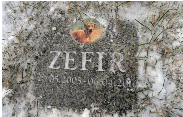
Il. 3. Gdańsk, grzebowisko Zawsze Razem – typowy nagrobek

Podczas prowadzenia badań nie znaleziono w Polsce nagrobków mających znaki religijne takie jak krzyże czy wizerunki świętych. Występują one natomiast w Niemczech, np. na cmentarzu w Monachium. Znajduje się tam figura