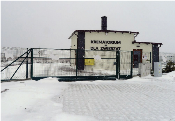
Il. 6. Gdańsk, grzebowisko Zawsze Razem