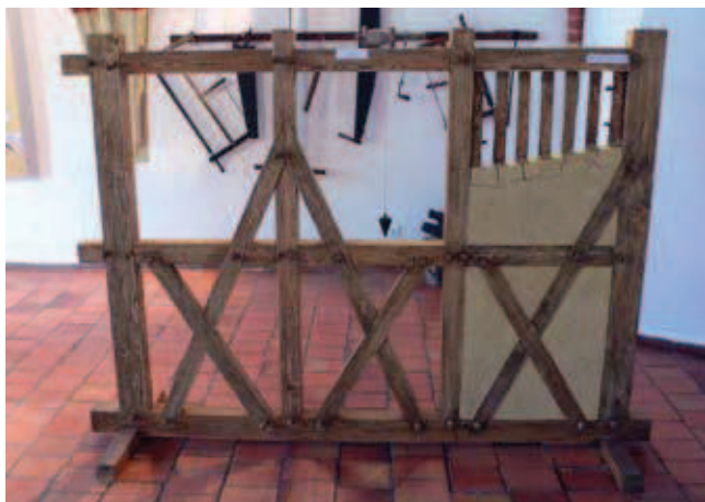
Rys. 6. Jawor, Muzeum Regionalne, fragment ekspozycji poświęcony historii i technologii wznoszenia Kościoła Pokoju