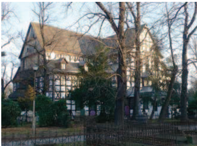
Rys. 3. Świdnica, Kościół Pokoju w otoczeniu cmentarza, 2014