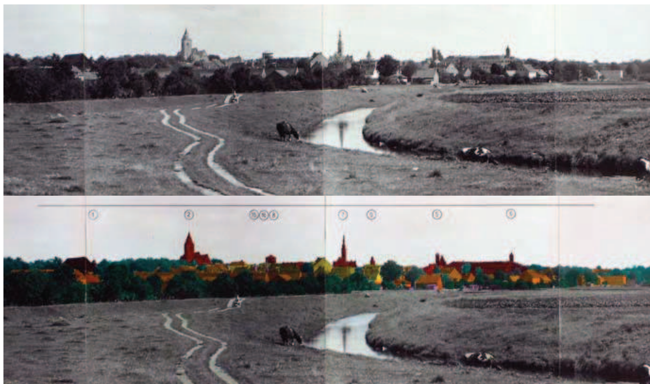
Rys. 5. Jawor, analiza krajobrazowa panoramy miasta historycznego z bryłą Kościoła Pokoju z lewej strony; archiwum Wojewódzkiego Urzędu Ochrony Zabytków – delegatura w Legnicy, 2013 (fot. W. Affelt)

że w intencji strony aplikującej o wpis na Listę Światowego Dziedzictwa UNESCO był to jeden wniosek tzw. zbiorowy. Spostrzeżenia na ten temat zawarto w ostatnim (poza schematem ogólnym) rozdziale VIII opracowania. Podstawowymi różnicami są: