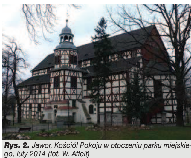
Rys. 2. Jawor, Kościół Pokoju w otoczeniu parku miejskiego, luty 2014