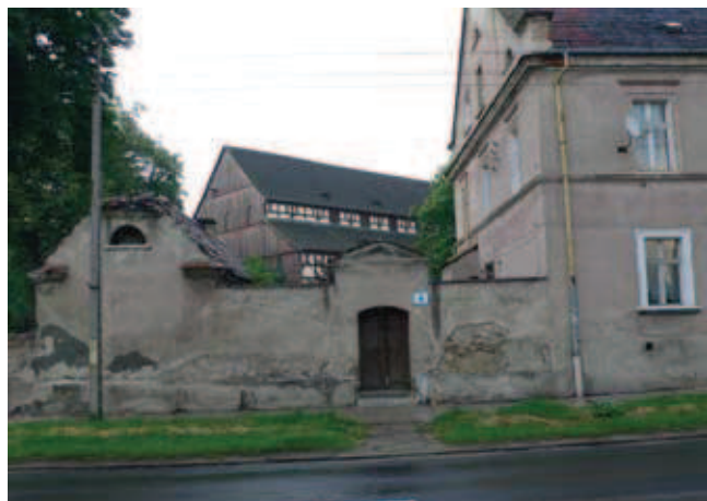
Rys. 4. Jawor, Kościół Pokoju widziany od ul. Starojaworskiej, 2013

znaczenie różnorodności kulturowej i kreatywności dla rozwoju ludzkiego, społecznego i gospodarczego oraz dostarcza narzędzi do zarządzania przemianami materialnymi i społecznymi oraz narzędzi, które gwarantują harmonijne zintegrowanie współczesnych ingerencji z dziedzictwem w kontekście historycznym i biorą pod uwagę uwarunkowania regionalne.