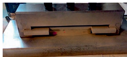
Rys. 4. Widok otrzymanego wskazania po jednym z procesów Fig. 4. View of the received indication after one of the processes

Wyniki badań zestawiono w tablicy numer 2. Każdy proces został powtórzony 3 razy, a wynik to średnia arytmetyczna z trzech prób. Ilość procesów zmniejszyła się z 12 do 10. Wynikło to z faktu, iż przy nanoszeniu penetrantu w pozycji podolnej czas wywoływania był krótszy niż 15 minut, w wyniku czego nie było zasadne nanoszenie kolejnych aplikacji penetrantu, które zgodnie z założeniami były nanoszone w odstępach 15 minut.