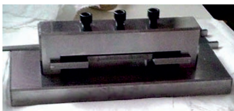
Rys. 2. Przyrząd, na którym były wykonywane badania Fig. 2. The apparatus on which the tests were carried out

Badania penetracyjne próbek z zasymulowanymi nieszczelnościami przeprowadzono z zastosowaniem penetracji barwnej, zgodnie z wymaganiami normy PN-EN ISO 3452-1. Próbki były umieszczane w urządzeniu wykonanym ze stali S960QL pokazanym na rys. 2 pomiędzy stalowym stołem o grubości 30 mm, a podkładką o grubości 10 mm.