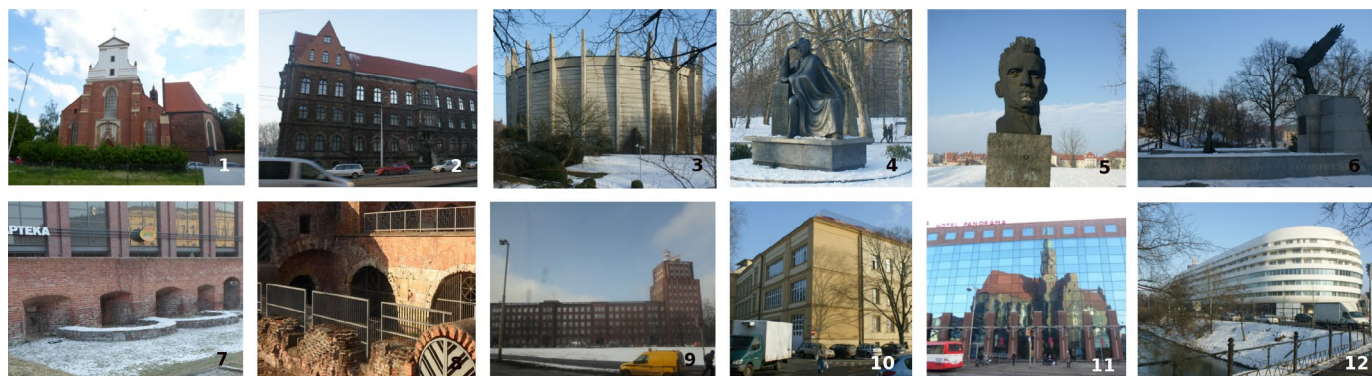
Ryc. 2. Wykaz fotografii: 1 – Muzeum Architektury, 2 – Muzeum Narodowe, 3 – Muzeum Panoramy Racławickiej, 4 – pomnik Juliusza Słowackiego, 5 – rzeźba Głowa Robotnika, 6 – pomnik Ofiar Zbrodni Katyńskiej, 7 – basteja, 8 – Wzgórze Polskie, 9 – Poczta Główna, 10 – Akademia Sztuk Pięknych, 11 – Galeria Dominikańska, 12 – wielofunkcyjny budynek OVO