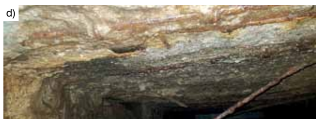
Rys. 2. Destrukcja kanałów ściekowych (obiekty nr 2) po 35 latach użytkowania: a) widok ogólny, b) destrukcja otuliny betonowej ścian i odsłonięte skorodowane zbrojenie, c) degradacja betonu stropu z odsłoniętym zbrojeniem, d) wyłamujące się samoczynnie zbrojenie stropu