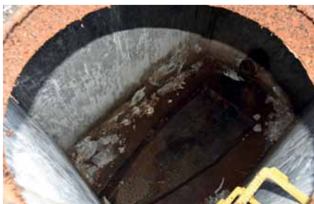
Rys. 1. Destrukcja napraw powierzchniowych komór rozprężnych (obiekty nr 1) w dwa lata po wykonaniu