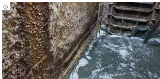
Rys. 3. Destrukcja komory rozdzielczej ścieków (obiekt nr 3) po około 10 latach użytkowania: a) wejście do komory – korozja betonu z odsłoniętym zbrojeniem, b) powierzchnia betonu pokryta produktami korozji, c) destrukcja ściany i widocznymi głębokimi wżerami w betonie w dolnej części i skorodowanym zbrojeniem

warstwy mineralnego materiału naprawczego łuszczyły się, lokalnie były odspojone, a lokalnie występowały ich ubytki. W kanałach (obiekty nr 2), gdzie nie było wypraw i powłok ochronnych, powierzchniowa warstwa betonu ponad lustrem ścieków o grubości około 30–40 mm była bardzo słaba i „miękką”, łatwo odspajała się pod uderzeniem młotka. Na ścianach występowały obszary ubytków otuliny zbrojenia, a odsłonięte zbrojenie wykazywało oznaki silnej korozji. Beton na stropach kanałów był porowaty, występowały „wżery” korozyjne, miejscami widoczne były ciemne nacieki i żółtawe wykwity. Na znacznej powierzchni występowały ubytki otuliny, a odsłonięte zbrojenie było silnie skorodowane (pręty dawały się łatwo wyłamywać z konstrukcji, a niektóre wyłamały się samoczynnie i zwiślały z konstrukcji). Komora rozdzielcza ścieków (obiekt nr 3) została zaprojektowana i wykonana z uwzględnieniem jedynie ochrony materiałowo-strukturalnej, czyli bez zastosowania powłok ochronnych. Po około 10 latach eksploatacji na ścianach i stropie