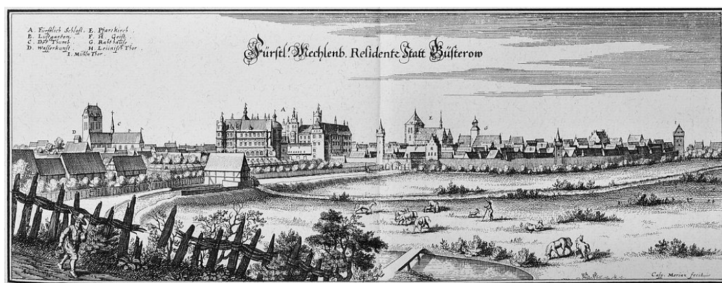
Ryc. 4. Zamek w Güstrow, sztych Matthausa Meriana z 1653 r.