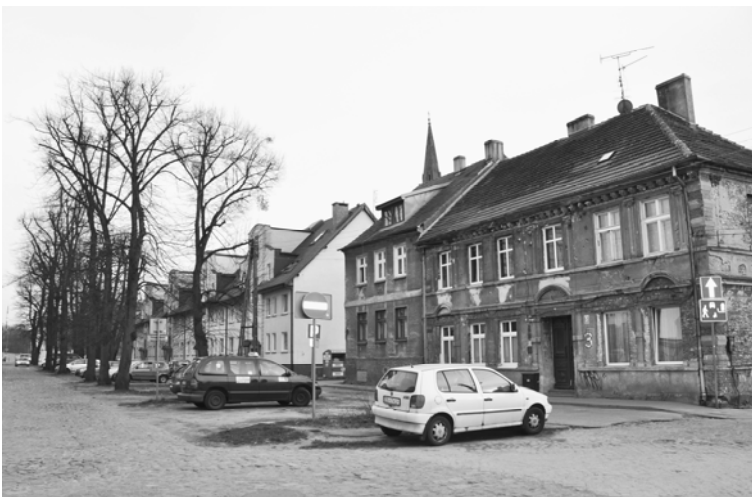
Fig. 4. The Old Town Landscape Area - preserved historical tenement houses in Miernicza St and a boulevard of linden as a mark of former river Mała Płonia

Ryc. 3. Staromiejska strefa krajobrazu - zachowane obiekty zabytkowe: renesansowy pałac i kościół Wniebowzięcia NMP - ulica Dziennikarska, 2017.