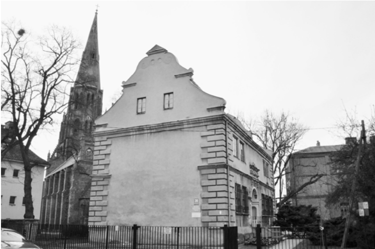
Fig.3 The Old Town Landscape Area - preserved historical buildings: renaissance prince's palace and the Church - Dziennikarska St - 2017

Ryc. 3. Staromiejska strefa krajobrazu - zachowane obiekty zabytkowe: renesansowy pałac i kościół Wniebowzięcia NMP - ulica Dziennikarska, 2017.