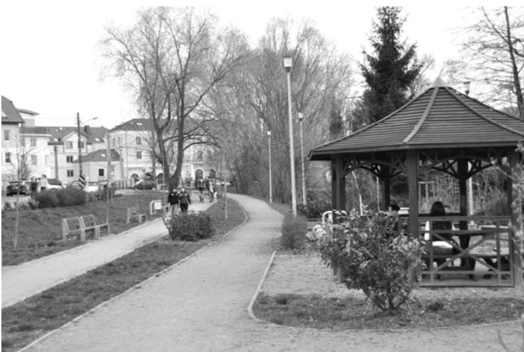
Fig.5 The Post-fortress Landscape Area - recreational banks of Płonia River, in the background Boncza Hotel built on the adapted XIXth century ruins of a water power station - 2017

Ryc. 4. Staromiejska strefa krajobrazu - zachowana zabudowa pierzei ulicy Mierniczej wraz z aleją lipową stanowiąca ślad przebiegu skanalizowanej Małej Płoni, 2017.