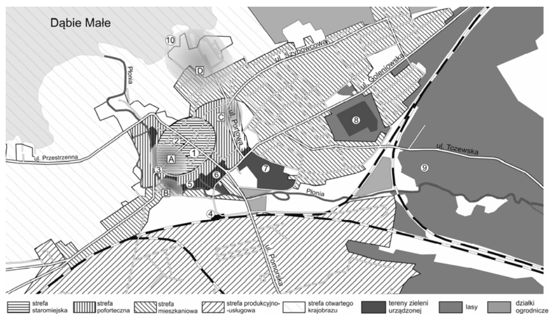
Fig.1 A-D: Identity important zones and streets with a high degree of historic landscape character legibility in contemporary Dąbie: A - Within Old Town Landscape Area - zone of streets: Miernicza, Oficerska, Lekarska, Dziennikarska, Krzywoń, Cicha, B - Within Former Fort Landscape Area - Park by Płonka, C - Within Former Fort Landscape Area - Portowa Street (east part), D - Within Villas Landscape Area - zone of streets: Żaglowa, Portowa (west side), Zamiejska. 1 - Miernicza St, 2 - Gierczak St, 3- Boncza Hotel, 4 - Railway Station, 5 - Park by Płonka river, 6 - Historic Square, 7 - K. Świetlińskiego Square, 8 Cementary, 9 - Urban forest, 10 - Bathing. Source: E. Sochacka-Sutkowska, A.Pilarczyk

linked to water and aviation sports, whereas the airfield and the lake are currently the main symbols of Dąbie. Also the villa zone is significant for the cultural value of Dąbie landscape. Its special fragment is the area of Portowa (fig. 6), Żaglowa and Przyjaciół Streets. The well-preserved tissue of the villa housing together with the Borcherts' Palace and the unique scope of visual and functional links between the town and the lake, which have survived until today, make this area exceptional. It is here that four landscape zones of Dąbie meet or come closer to each other in a characteristic manner, building its identity: the old town, post-fortress, villa and open ones (fig. 2).