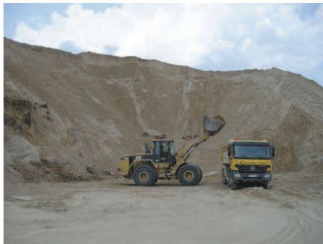
Rys. 5. Widok skarpy eksploatacyjnej w kopalni piasku Fig. 5. View of the operating slope in sand mine

Kopalnie prowadzące eksploatację łądową kruszyw żwirowo-piaskowych (w większości piaskowych) lub innych kopalin okruchowych i ilastych geometrią zbliżone są do typowych kopalń prowadzących eksploatację łądową. Ze względu na wykorzystanie transportu kołowego konieczne jest utrzymanie dróg technologicznych, które podobnie jak w kopalniach węgla brunatnego dzieli się na stałe oraz tymczasowe (rys. 5).