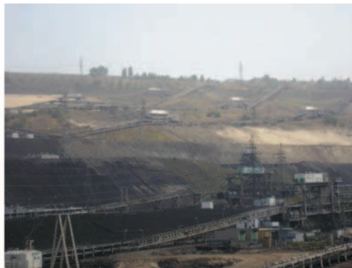
Rys. 2. Infrastruktura w kopalniach węgla brunatnego: a) droga w trudnych warunkach terenowych, b) układ przenośników taśmowych