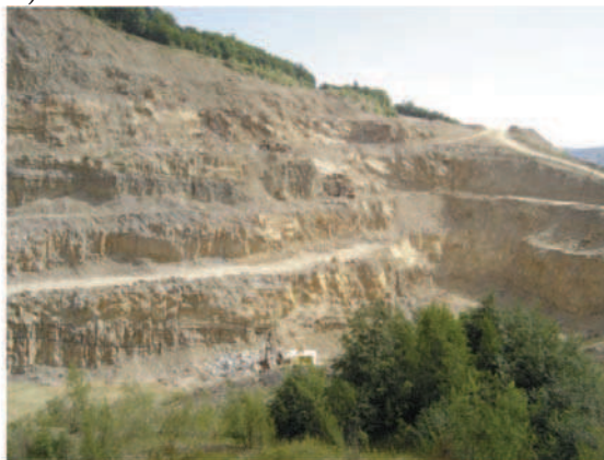
Rys. 6. Wyrobisko kopalń kopalni zwięzłych: a) wglębne, b) stokowe