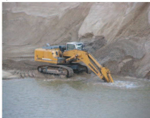
Rys. 4. Przykłady technologii wydobycia kruszyw żwirowo-piaskowych spod wody: a) pływającą pogłębiarką chwytakową, b) koparką jednonaczyniową z łądu