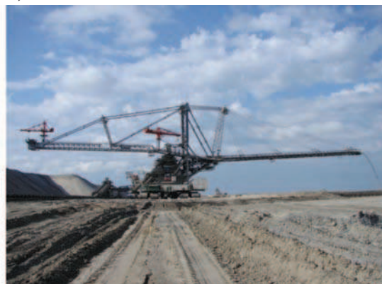
Rys. 3. Maszyny podstawowe w kopalniach węgla brunatnego: a) koparka wieloczerpakowa kołowa, b) zwałowarka