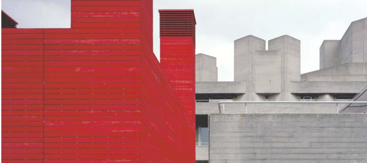
Il. 2. The Shed, źródło: https://www.haworthtompkins.com/work/the-shed (dostęp 23.03.2020) / source: https://www.haworthtompkins.com/work/the-shed (accessed 23.03.2020)