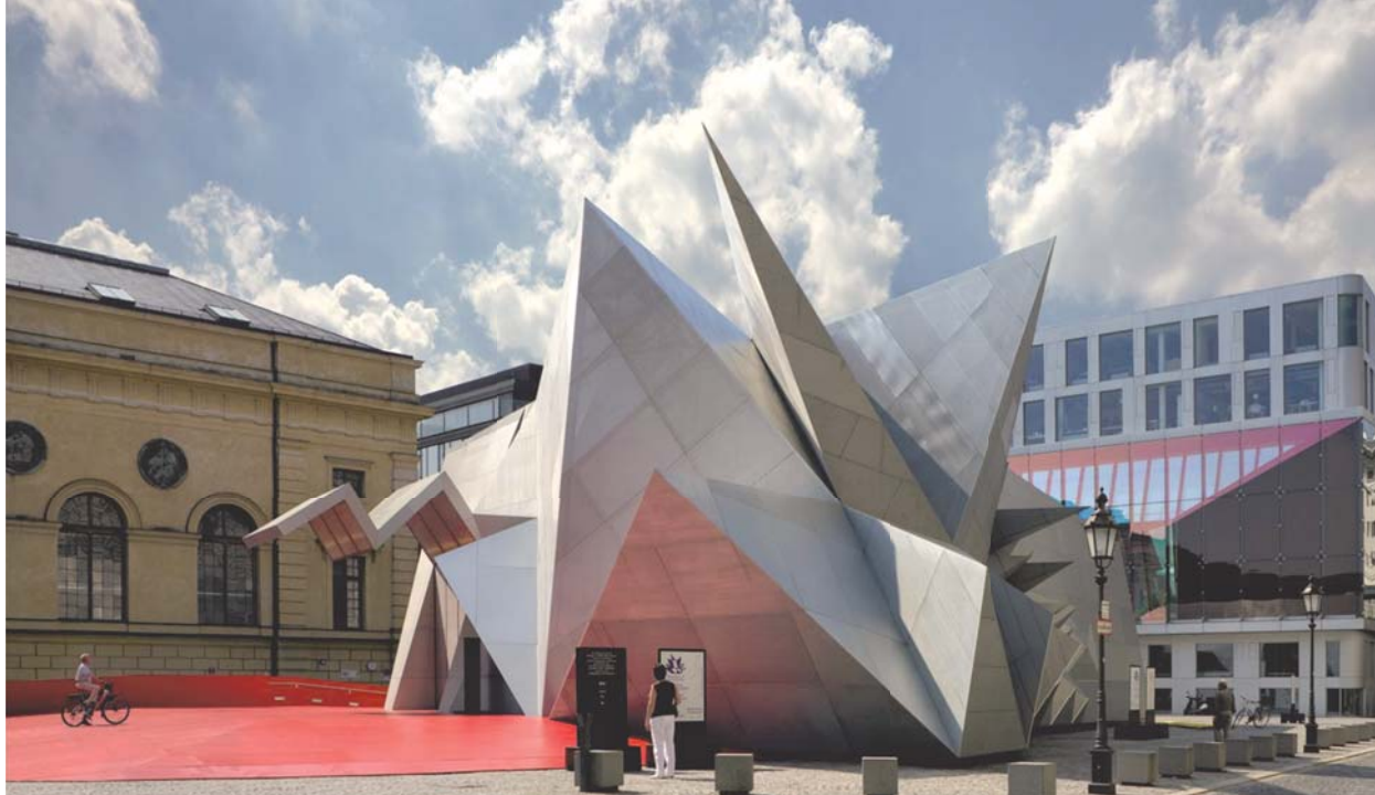
Il. 6. Pavillon 21 MINI Opera Space, źródło: http://www.coop.himmelblau.at/architecture/projects/pavilion-21-mini-opera-space/ (dostęp 23.03.2020) / source: http://www.coop.himmelblau.at/architecture/projects/pavilion-21-mini-opera-space/ (accessed 23.03.2020)

Powołując się na powyższe przykłady, można śmiało dojść do konkluzji, iż teatry o cechach tymczasowych nie są wyłącznie elementami zastępczymi, pełnią też ważną autonomiczną funkcję w przestrzeni, wyraźnie integrując społeczność. Ich forma w zdecydowanej większości charakteryzuje się wysokimi wartościami estetycznymi, kształtującymi otoczenie, nadającymi mu nowego znaczenia.