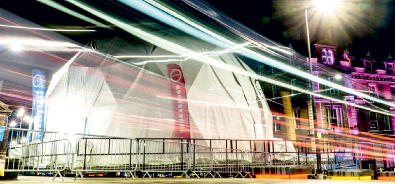
Il. 3. Roundabout

kontakt widzów z artystą. Pozwala to na wyeliminowanie bariery między aktorem, a widzem i obcowanie ze sztuką w sposób wręcz namacalny.