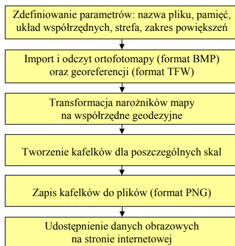
Rys. 1. Schemat działania aplikacji Ortofoto

Następnie należy utworzyć warstwę kafelków, poprzez stworzenie obiektu klasy GTileLayer z 3. argumentami (zbiór praw autorskich dla poszczególnych skal i zakresów map, minimalna i maksymalna skala, w jakiej wyświetlane będą warstwy) i skojarzenie funkcji odczytującej kafelki z nowotworzoną warstwą. Do funkcji getTileUrl klasy GTileLayer należy dopisać funkcję odczytującą. Po definicji sposobu, w jaki tworzone będą warstwy należy utworzyć nowy typ mapy tworząc obiekt klasy GMapType , który ma składnię składającą się z 4. argumentów (tablica warstw tworzących mapę, rodzaj projekcji, nazwa mapy, dodatkowy parametr zawierający opcje mapy).