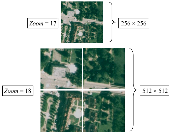
Rys. 2. Kafelki w piramidzie obrazów przy zmianie wartości powiększenia ( Zoom ) z 17 na 18