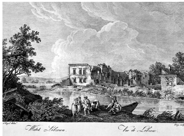
Ryc. 1. Porównanie ryciny Vogela z komputerową rekonstrukcją ruin