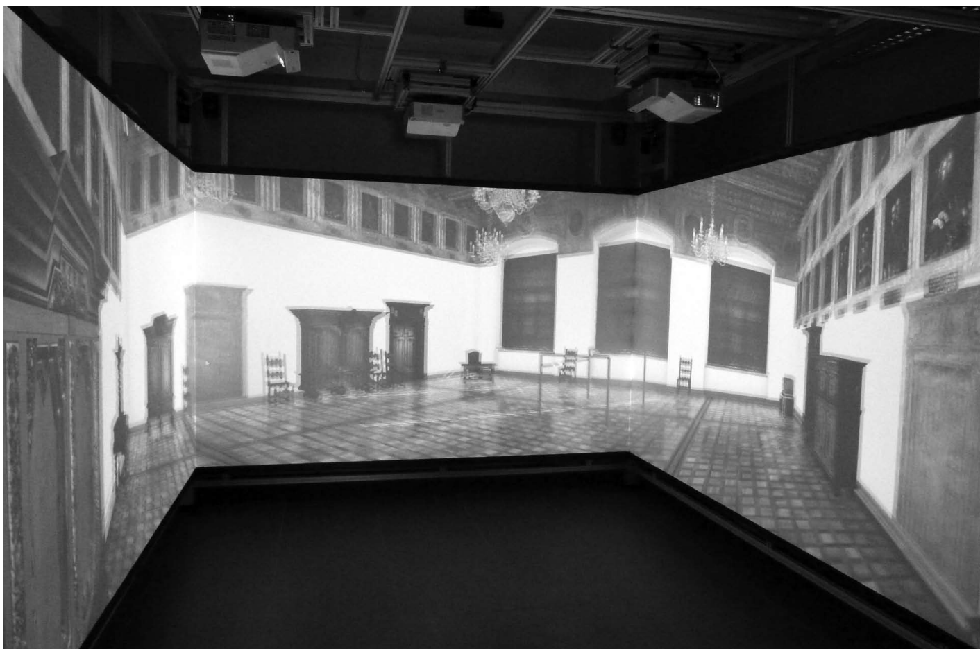
Ryc. 2. Model w przestrzeni CAVE