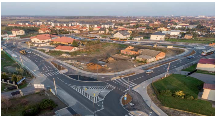
Fot. 7. Widok skrzyżowania ul. Głębockiej z ul. Berensona i ul. Lewandów

gającej na wykonaniu przesłony przeciwfiltracyjnej oraz budowy muru przeciwpowodziowego. Projekt uwzględnia także rozmieszczenie w miejscach zjazdów i zejść do Wisły mobilnych zapór przeciwpowodziowych, umożliwiających zabezpieczenie terenu zalewowego w przypadku wysokiego stanu wód na rzece.