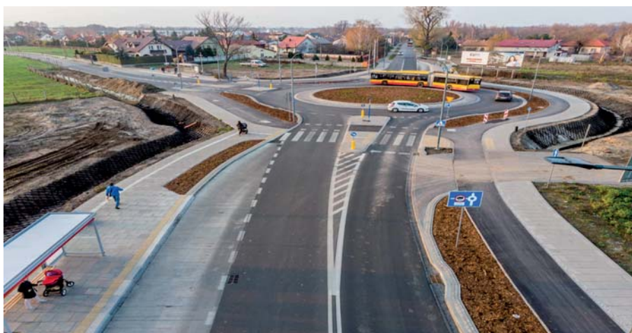
Fot. 6. Widok przebudowanego skrzyżowania ul. Berensona z ul. Kąty Grodziskie