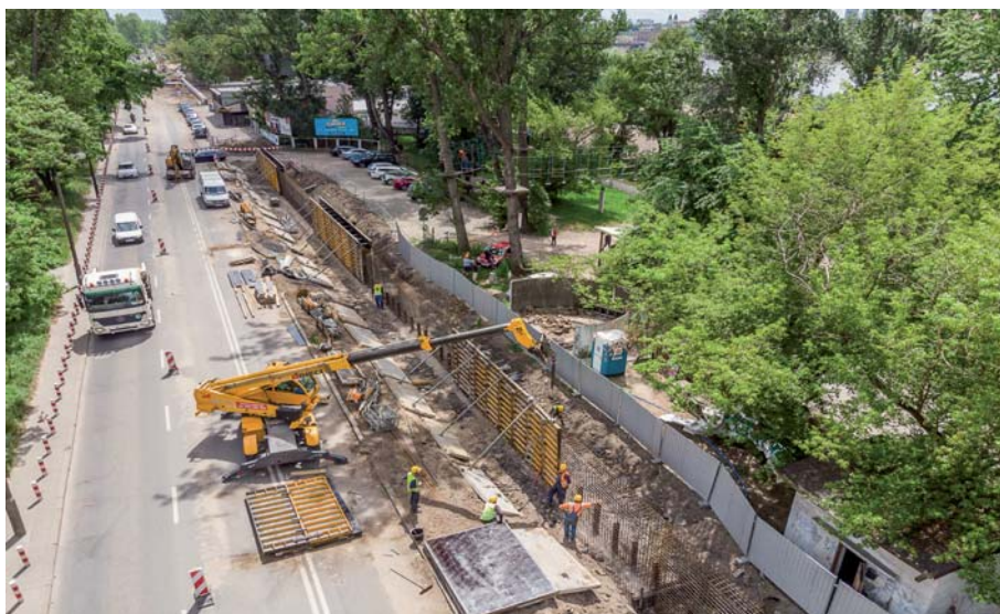
Fot. 9. Budowa muru przeciwpowodziowego – widok z drona