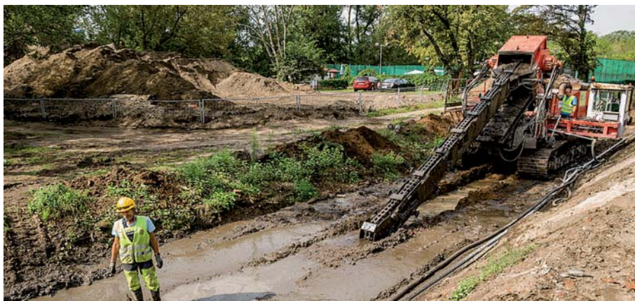
Fot. 8. Budowa zabezpieczenia przeciwpowodziowego w ul. Wybrzeże Helskie