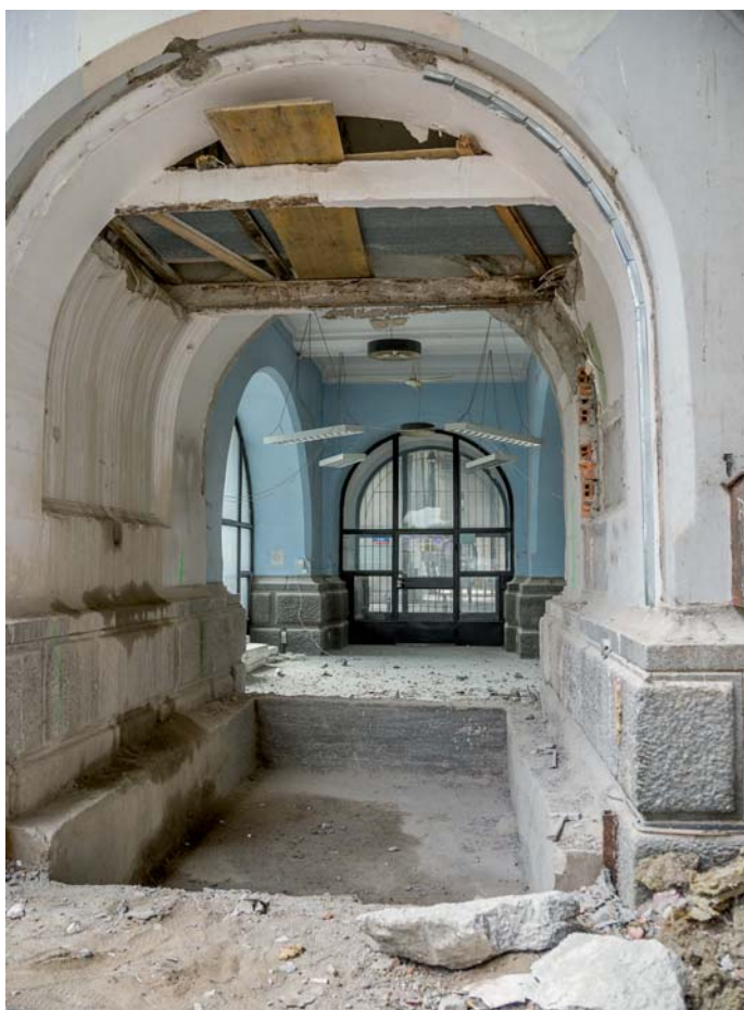
Fot. 4. Roboty przygotowawcze do montażu wind przy wiadukcie mostu Poniatowskiego