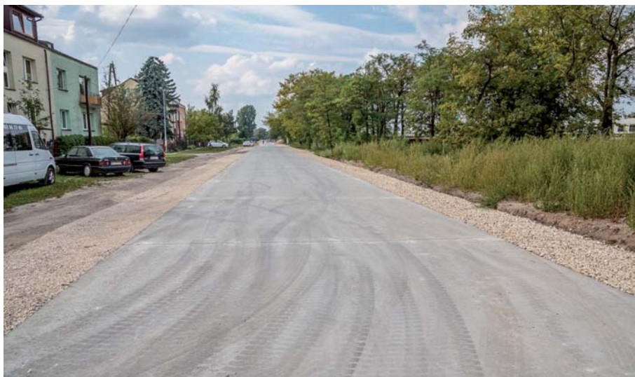
Fot. 3. Jezdnia ulicy utwardzona metodą betonu wałowanego