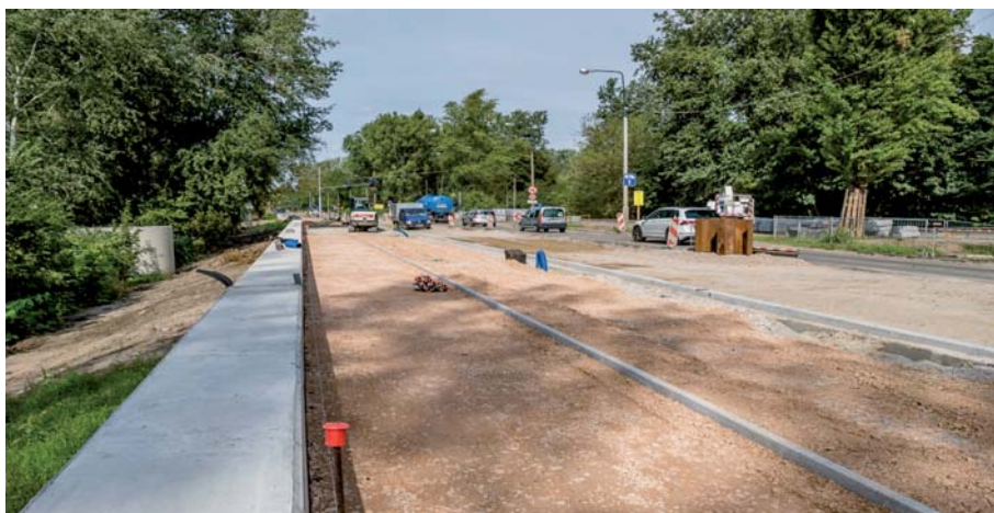
Fot. 10. Widok muru przeciwpowodziowego wraz z budowaną infrastrukturą drogi

zwalająca na przeprowadzenie archeologicznych badań wykopaliskowych w rejonie kościoła pod wezwaniem Św. Michała Archanioła wydana przez Mazowieckiego Wojewódzkiego Konserwatora Zabytków;