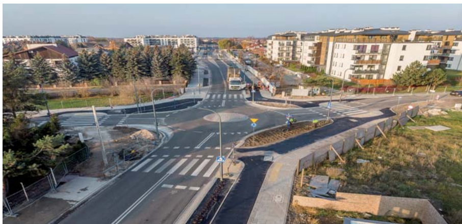
Fot. 5. Widok przebudowywanej ul. Głębockiej