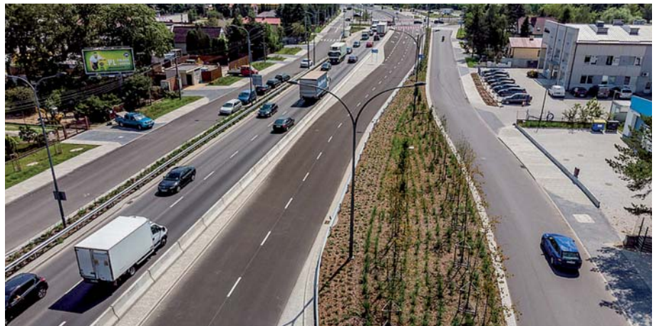
Fot. 1. Widok przebudowywanej ulicy Wał Miedzeszyński