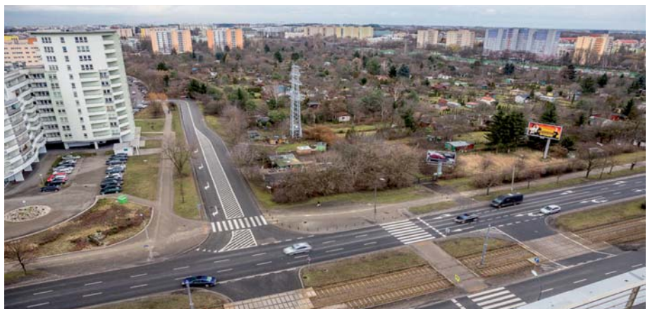
Fot. 2. Widok ulicy Grójeckiej przed rozpoczęciem robót