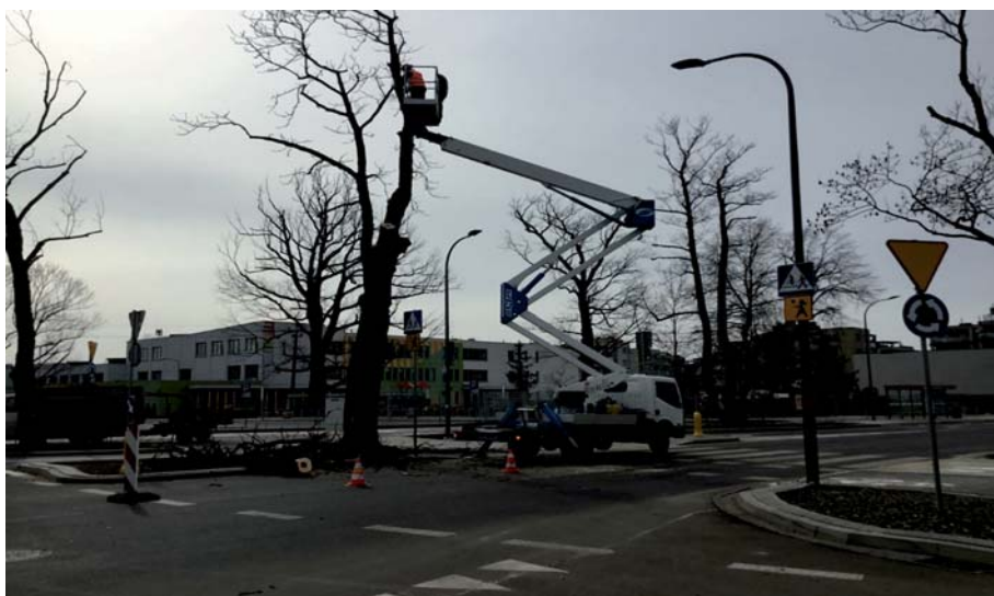
Fot. 11. Drzewo przeznaczone do wycinki, które ograniczało widoczność przejścia dla pieszych