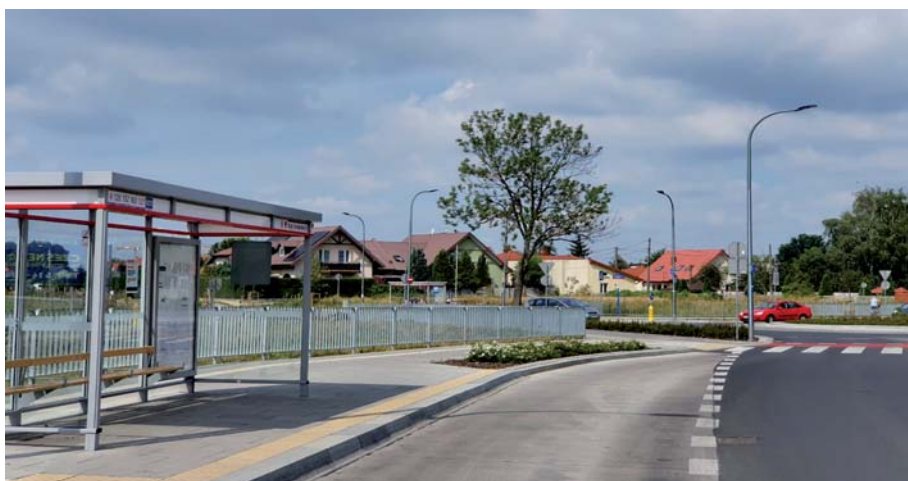
Fot. 12. Widok dodatkowych wygrozdzeń rowów odwodnieniowych

Powstałe Państwowe Gospodarstwo Wodne Wody Polskie dopiero zatrudniały nowych pracowników i wyposażały w sprzęt komputerowy. Wstępne informacje uzyskane od Wód Polskich stwierdzały ok. półroczny okres oczekiwania na wydanie decyzji. Po konsultacjach złożono wnioski o zmianę w ww. zakresie pierwotnego pozwolenia wodnoprawnego. Po 15 dniach od dnia złożenia wniosku została wydana decyzja zmieniająca pozwolenie wodnoprawne wydane przez Starostę Legionowskiego, pozwalając na zrzut wody z wykopów.