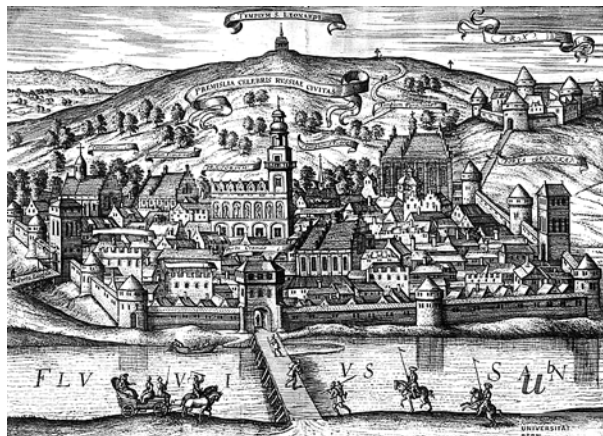
Ryc. 4. Widok Przemyśla z XVI wieku – miedzioryt F. Hogenberga z dzieła Civitates Orbis Terrarum wydanego przez G. Brauna, źródło: http://eloblog.pl/polskie-miasta-na-starych-panoramach/ (dostęp: 17.06.2018)

Fig. 3. View of Jarosław from the second half of the 17 th century, print in the periodical “Przyjaciel Ludu” from 1846, source: collection of the Orsetti House Museum in Jarosław