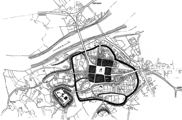
Ryc. 2. Przemyśl – zespół miejski w drugiej połowie XIV wieku. Legenda: a – zamek, b – podzámcze, c – obwarowania miejskie, d – miasto lokacyjne, 1 – budowla pałacowa, 2 – cerkiew, 3, 4 – kościoły

Fig. 1. Jarosław – metrological analysis of the former chartered town superimposed on the cadastral plan, prepared by the author. Green colour indicates the cable grid, blue – building blocks and the area of chartered town, red – the main market